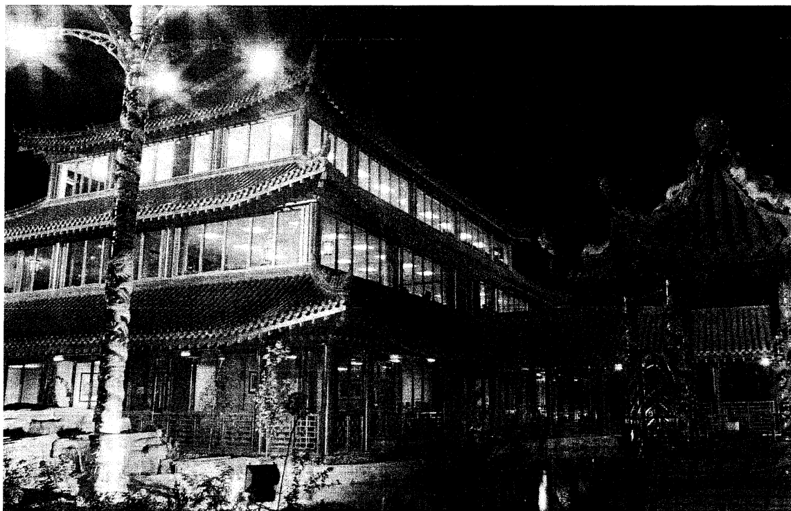
英達科技中國傳統式建築的廠房，現為泰爾福鎮的新地標。

價，因此業務拓展很快，第一年即有6萬英鎊的收益；到了第三年公司廠房辦公室更從最早期以家中車庫改建的簡陋辦公室，到6000坪的自地所建的廠房、辦公室。