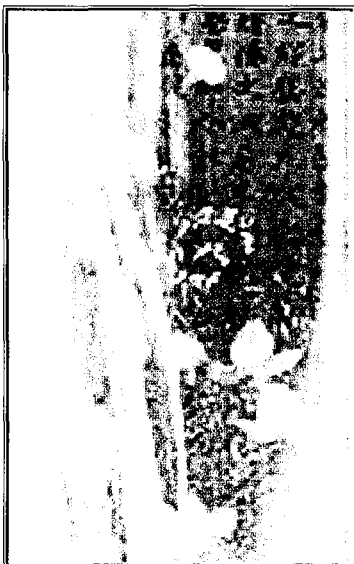
玄同 60cmx100cm 電腦繪圖+書法

老子第五十六章：「知者不言，言者不知。塞其兌，閉其門，挫其銳；解其紛，和其光，同其塵，是謂玄同。」和光在求抑己，同塵在求隨物。想像自己是風沙亦是星辰，俯仰天地，有何好爭？