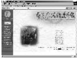
楊英風數位美術館首頁

「鳳凌霄漢」是由「月恆」、「回到太初」、「小鳳翔」等鳳凰系列演化而來。簡潔有力的五道鋼片，精準有緻地開展出羽翼成熟、穩健翔凌於霄漢的鳳凰。中國的思想中，龍是萬變力量之源，而鳳則是太平祥和的挺現。作品中，展翼飛翔的鳳凰給人光彩耀目、神采飛揚的形象，它象徵著以智慧迎向未來、開創無限生機、及繁榮盛世的永續經營。