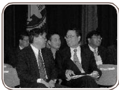
校友返校，左為魏哲和學長，右為施振榮學長。

宏碁集團董事長施振榮特地前來向兩位校友恭賀：一位是甫獲得交通大學80學年度傑出校友獎的林家和學長；另一位是三月初剛榮任國科會主委的魏哲和教授，魏教授是施學長在交大時的同班同學。施學長並於會場上發表對交大、陽明合併案及璞玉計畫的看法，他激昂地說：「我們要往前看，交大、陽明的合併是一個契機，我覺得阻力不應該來自校友、校園。我和宣明智、曹興誠討論過，如果合併是項正確的決定，那麼不管將來校名是什麼，都應該促成。對於璞玉計畫的看法，施學長則說：「我剛進交大時，校地只有一甲多，校方經常得花很多時間上台北爭地，所以對於璞玉計畫中交大竹北校區，將會全力支持。面對知識經濟，校園再大，要有K（Knowledge，軟體）才靈；政府沒有預算給璞玉計畫，校友們應該全力支持，感動政府也來支持這個對國家未來發展有助益的計畫。」