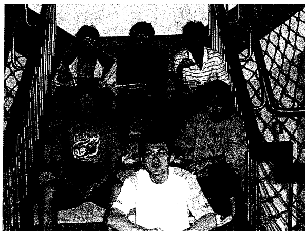
▲ 大三同學，此次系慶的幕後工作主力