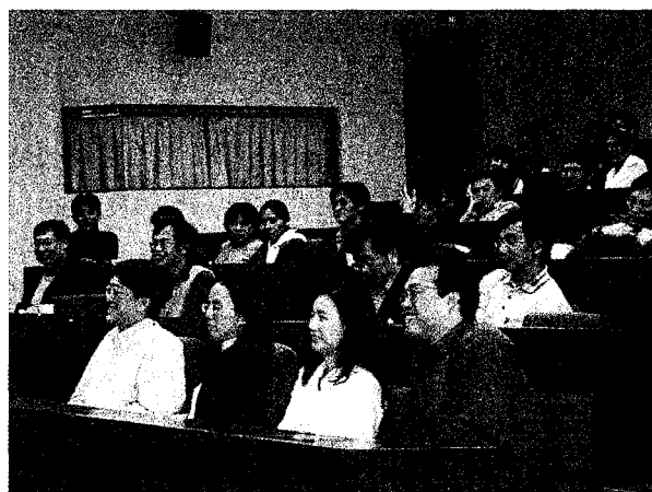
▲ 系友會成立大會一景