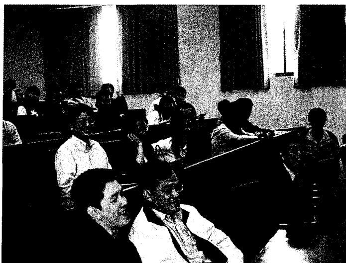
▲ 系友會成立大會一景

工工管系在過去的 20 年間就如一個呱呱落地的嬰兒般一天天的成長、蛻變，其間有許多初次嘗試的生澀與錯誤，也有許多初次的成功與歡愉。今日，當我們為自己在台灣的工工管界有立足之地、意興風發之餘，是否也格外的感念那些因緣際會曾在我們