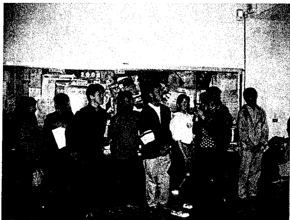
▲ 大四的帥哥美女和學長們