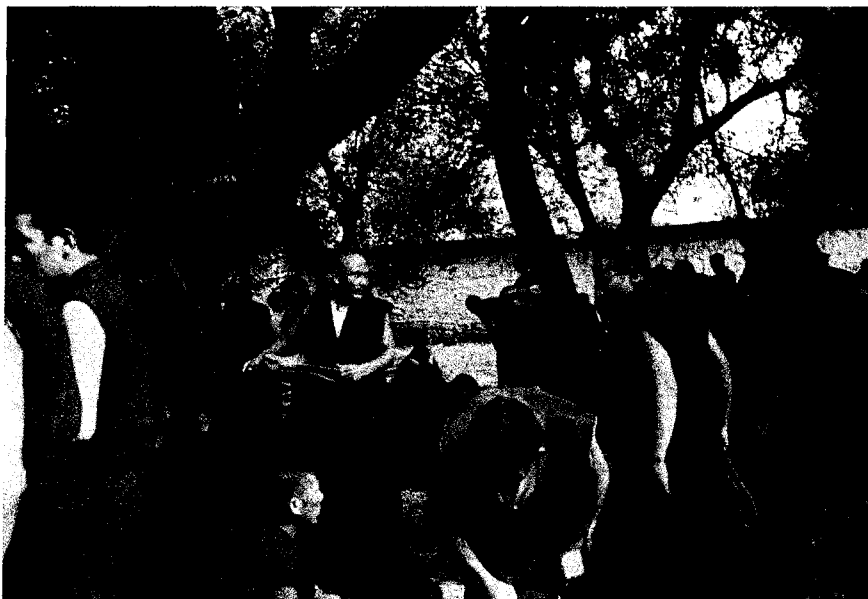
▲ 拉薩哲蚌寺喇嘛辯經團

的「龍骨」就是礦物。中醫一向有一種好處，就是“無病不能醫”，各科對症之藥均能出籠。因此，希望能得奇效治療的人，自然也都是慷慨解囊，尋求自己所需要的良藥了。反正是各取所需，皆大歡喜。