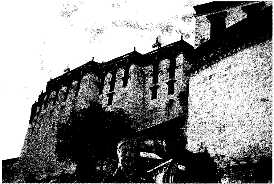
▲ 海客學長賢伉儷攝於布達拉宮之外

主體建築是以木石結構，採用典型的藏式平頂，簷部斗拱則具有漢族建築的色彩，雕樑畫棟，彩繪藻井，宮前有迴環交錯的花崗石圍牆，之字形的石階蹬道，將全宮組成了一座莊嚴的大城堡。宮內有佛堂、經室、平台、庭