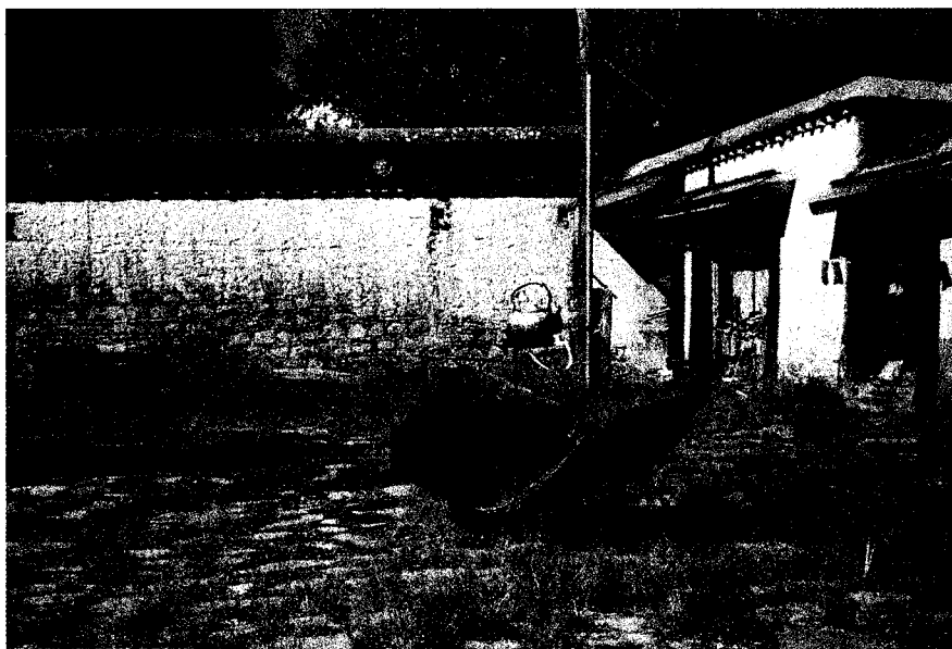
▲ 夏宮羅布林卡院中之太陽能煮水器

我們又去了一處叫做「藏草堂」的藏醫藥中心參觀，藏醫在基本上是以中醫為基礎，現在當然也參考了西醫，譬如：一進門就看到人體解剖圖；另外早已設置針灸室、推拿室，來賓可以免費嘗試，更重要的是推銷藏藥。他們很自豪地說，藏藥包括了各項中藥，但是，祇有藏藥中含有礦物成份；其實不然，中藥中