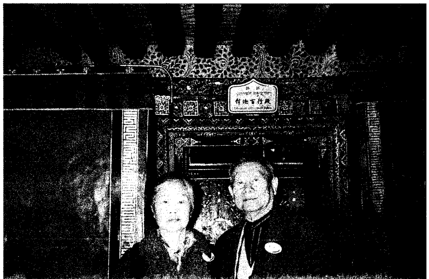
▲ 海客學長賢伉儷攝於布達拉宮之內