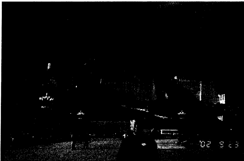
▲ 海客學長攝於達拉宮廣場

布達拉宮最近一次的大修是一九八七年。中共國務院接到一份緊急報告說：布達拉宮年久失修，危房處處，險象環生，若不及早維修，恐有整個建築坍塌之虞，千年瑰寶，毀於一旦，豈不可惜，因此，必須要迅速進行大規模的維修。當時即由政府決定：「不改變現狀，整舊如舊。」先把腐朽的木椽換掉，在土