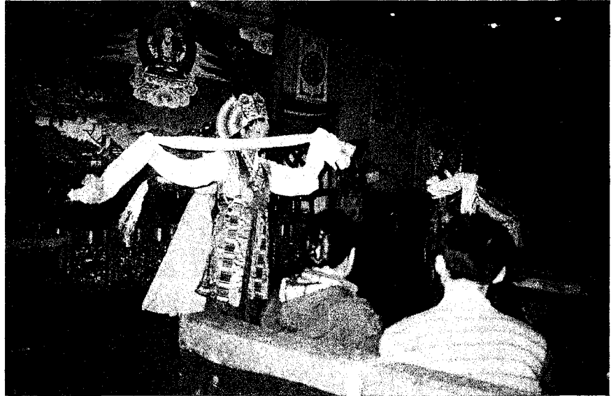
▲ 拉薩餐廳內藏式歌舞

結束了四夜三天的青藏高原之旅，我們回到世界上最高的機場，拉薩機場，乘飛機往成都而去。(全文完)