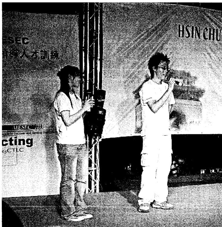
上場主持「新竹之夜」

二〇〇五年七月八日「AIESEC 夏季全國大會暨領導人才培訓」正式在張校長的一席勉勵話中揭開序幕。這六天的活動中，我們走出了學校，和市民做更多的互動，其中七月八日晚上在玻璃工藝博物館前廣場舉行的「新竹之夜」，更邀請新竹林政則市長和台新銀行總經理蔡孟峰學長蒞臨會場，給新竹市民及來自全國各地的大學生一個體驗在地文化之美的機會。七月十日下午在園區同業公會的大廳內也舉辦了「國際嘉年華會」，讓在場民眾驚艷了各國文化。