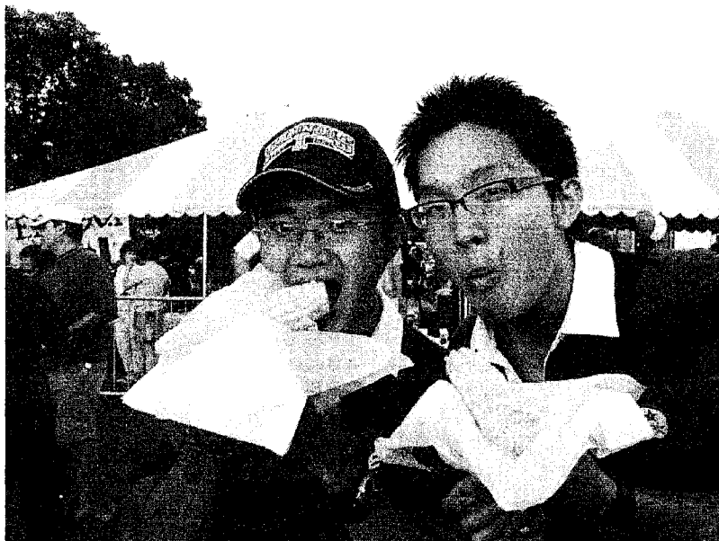
伊利諾州的玉米節

這一趟出國讓我改變了許多想法：我認為美國之所以強大是因為其擁有來自全世界的人才，尤其是印度學生給我的衝擊最大！