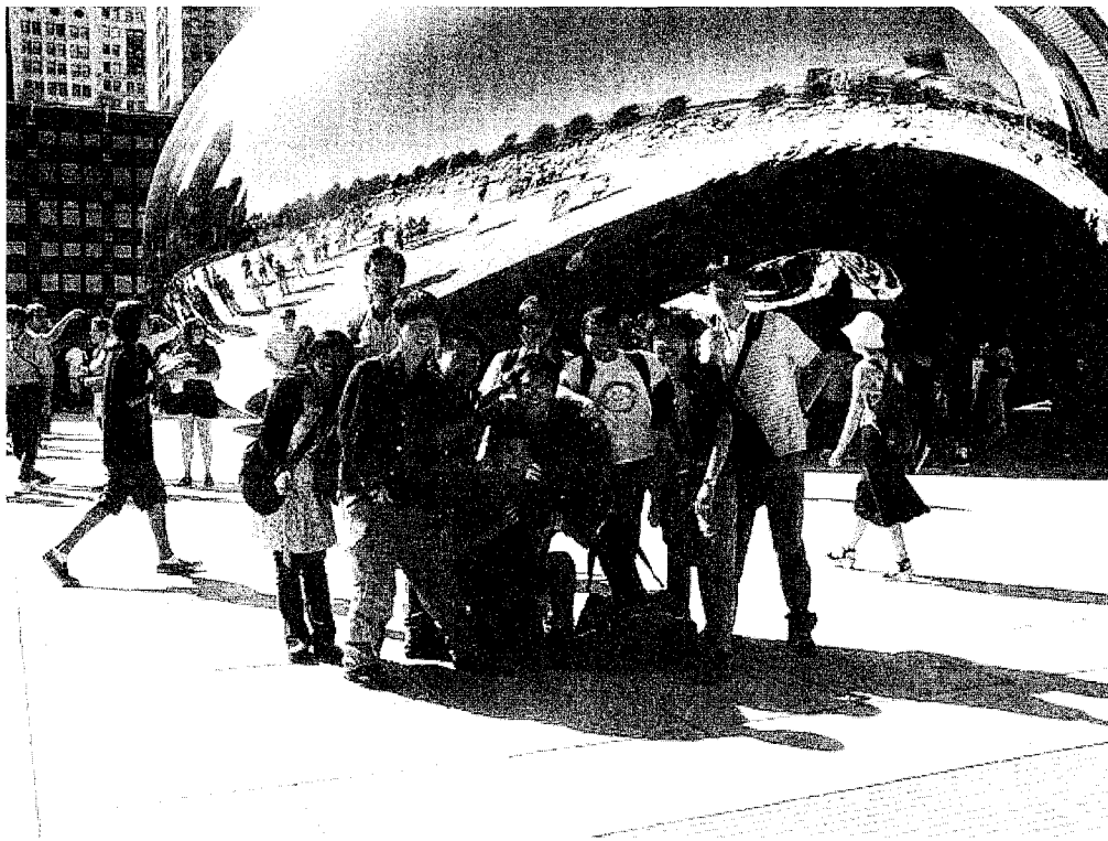
UIUC 芝加哥之行

間，所以這個區域是機能完整的大學城，其中最普遍的交通工具是公車，UIUC的學生只要拿學生證就可以免費搭車，這讓我們節省不少交通支出，也實質感受到UIUC學生在大學城裡受到的禮遇。