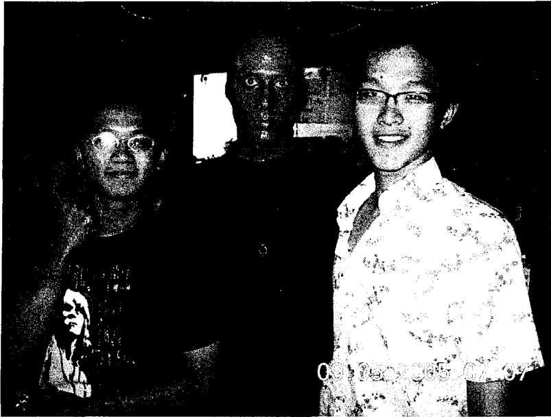
看完Blueman與Blueman合照

我們親身見識到美式家庭在宴客時所注重的禮儀與規矩，這與台灣習以為常的遲到作風是截然不同。另外，通常這類的家庭聚會，成員都要表演一點自己的拿手絕活，好比是唱節慶歌曲或是跳舞彈琴之類的，總之，這次的萬聖節聚會真的令我們印象深刻。