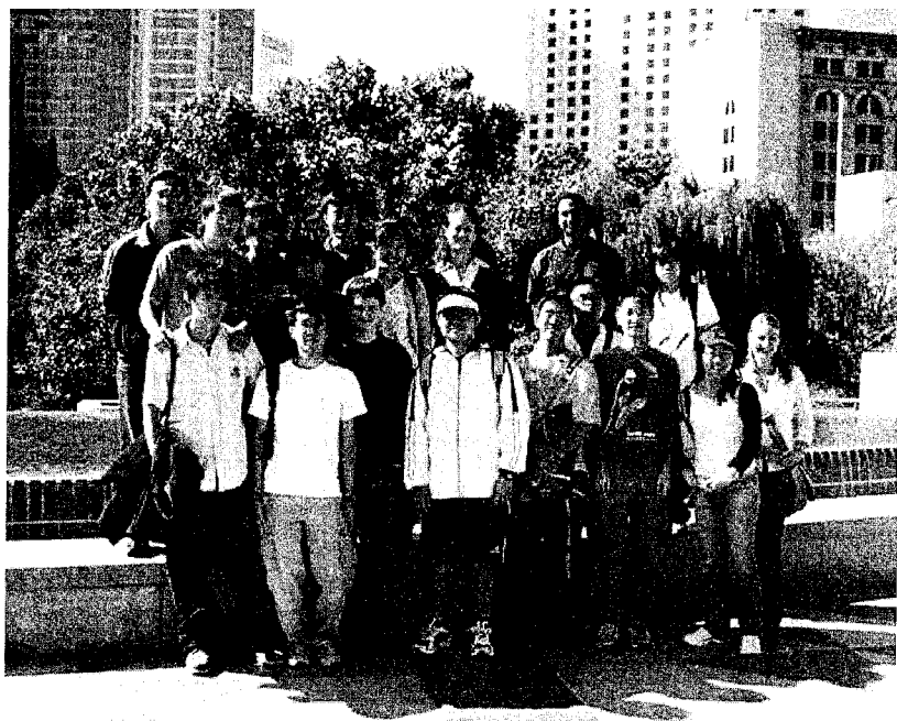
◀圖▲圖為作者參加International house Sunday supper 活動

各國在此的學生都很優秀，但令我最感佩服的是印度人，英文好，頭腦動得又快，所以很多助教都是由他們擔任，而且我遇到最厲害的助教也是印度人。記得在期末的最後一堂課，不論是正課或都是討論課，下課前學生們都會給與教授和助教感謝的掌聲，這種感覺很棒。一學期的辛苦，都在掌聲中落幕，在回嚮中感恩，所有的付出都化做甜美的果實以及美麗的回憶。