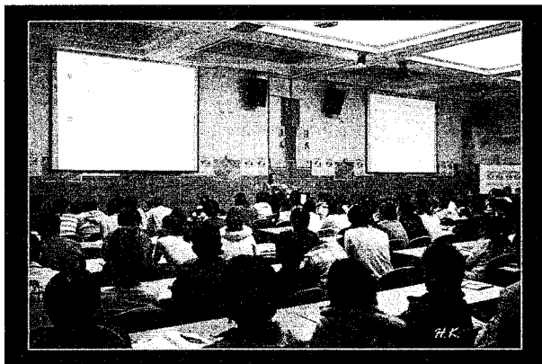
邀請知名學者李家同教授演講