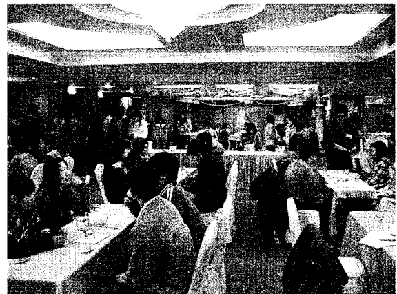
男女對對碰，過去幾年是舉辦拋繡球活動