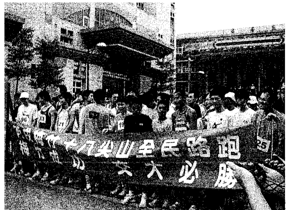
提倡全民運動，舉辦十八尖山路跑活動