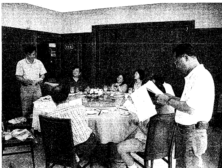
▲EMBA II 股東大會