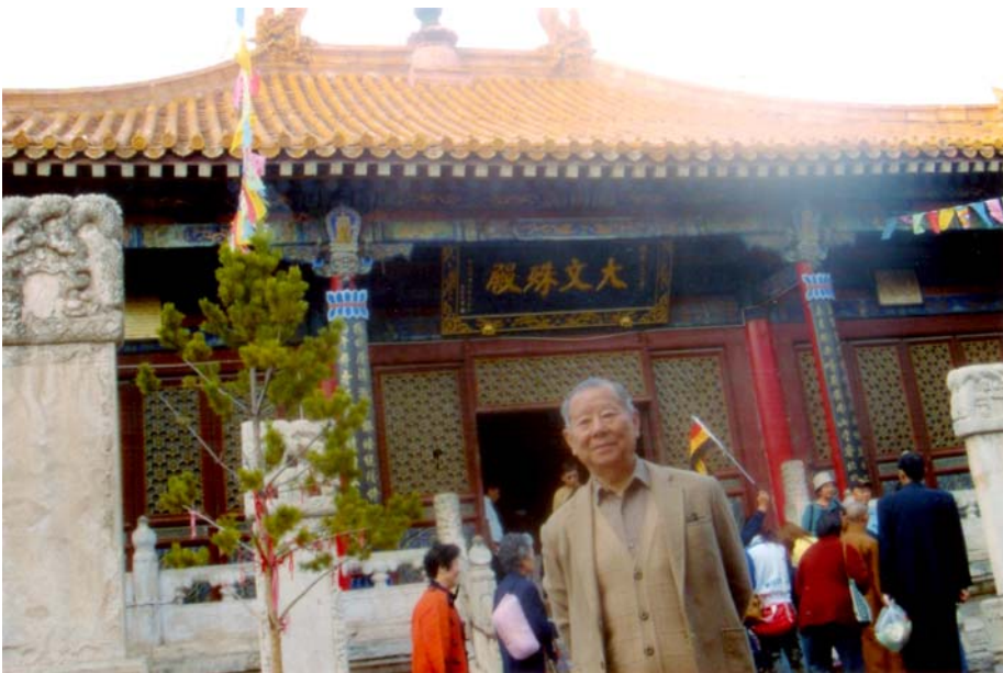
▲五臺山菩薩頂—大文殊殿

晉祠中參天的古樹也給人們留下了深刻的印象，「周柏」相傳是兩周時植，與「唐槐」同為至寶，如今，古柏、禮泉以及彩塑侍女，已被遊客稱為：「晉祠三絕」，非常受到參觀者的重視和欣賞。