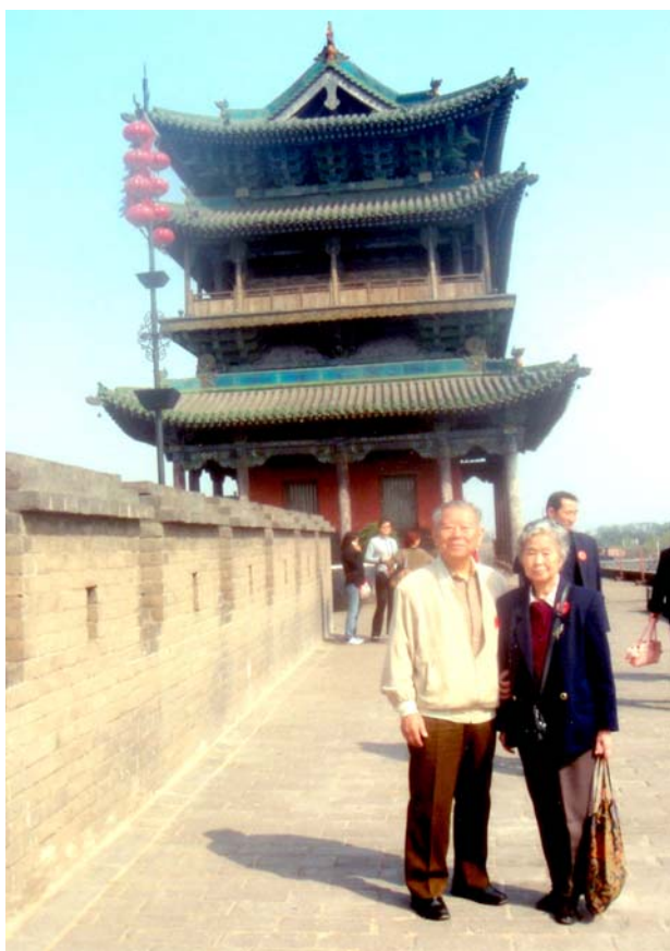
▲平遙古城—城樓(在古城牆上)

平遙是一座古城，遠溯自西周宣王時代，即已是屯兵的重鎮，距今已有兩千七百多年，現在已經被聯合國列入世界文化遺產名錄之中。平遙的縣名是在南北朝時代，由北魏的太武帝所命名，到現在也有一千五百年了，它所保留下的古城牆和街道房屋都是明清以後的建築，但是，少講一點也有六七百年，因此，平遙十足地可以稱之為「古城」。