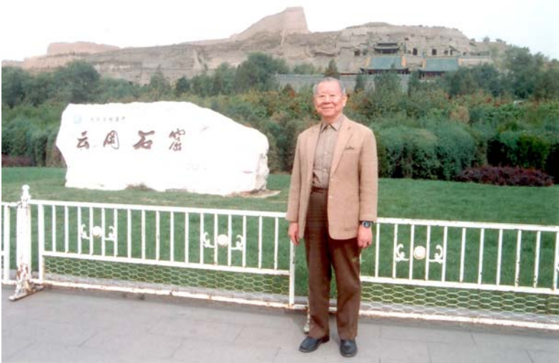
▲雲岡石窟—全景遠眺

震，均未損壞，真是奇蹟。懸空寺所以能維持長久，另外有三種原因，一是地形之利，懸空寺是建造在「山坳」之中，有天然保護的作用，不受落石的衝擊；其次是天時，因在山谷之間而免於日照和氣候的侵蝕；更重要的則是人爲的照料，保持維修，才能維持久遠，懸空寺的構造玄奇，令人嘆爲觀止。