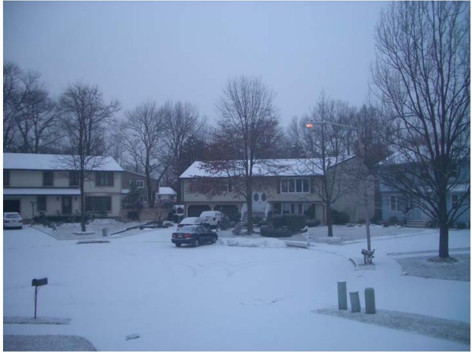
▲舅公於紐澤西州像薑餅屋般的房子

倒數著預定赴美的日子，2007年2月26日我一個「弱」女子獨自拖著四個加起來80公斤重的行李，折騰了二十個鐘頭的飛行航程來到美國，開始我為期三個月的流浪計畫。為節省經費，機票和住宿的旅館當然得貨比三家，若有親朋好友願意協助，住宿費便得以刪減，但為避免造成困擾還是得斟酌時間長短；吃的部份雖然要省但