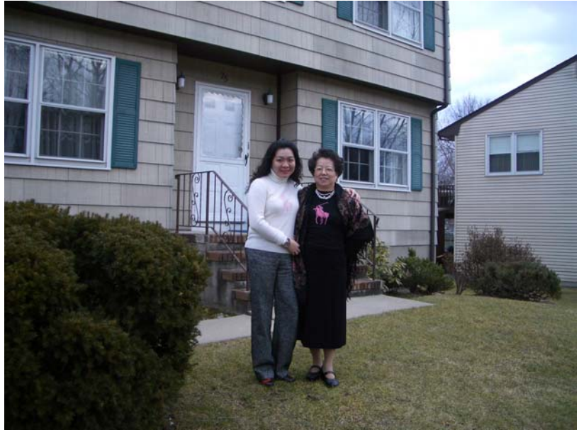
▲作者於舅公紐澤西州家前與舅婆合影

慮到這點，他要我不用擔心。但……另一個讓我擔心的問題是，在過去十趟的出國經驗中，從來不犯時差的我，這回居然在第四天犯了，不過是想午休個20分鐘，但我作夢了，拜託！20分鐘有什麼好夢的，就在懷疑自己到底是在台灣還是在美國時，我被窗外黑壓壓的一片嚇醒了，看了錶才驚覺自己已經睡了7個鐘頭，我的媽呀！我把午休當晚間睡眠用，就表示我的生理時鐘沒有調過來，這要怎麼參加考試呀？滾下床後第一件事就是拜