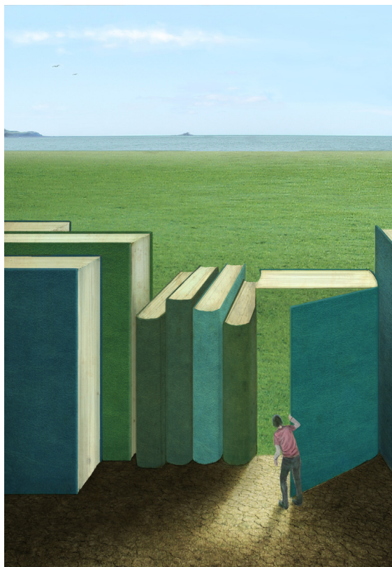
今年六月國立交通大學出版之《說書》

今夏尤其很不一般，我們有此機緣在《交大友聲》著輯出這期十月號新文藝課的主題。其實本課在三個月之前，剛剛推出本課的第一本導讀文集，是為：《說書》（詳參本課專屬網站： http://www.cc.nctu.edu.tw/~nrrp ）。這是為時接近一年的邀、編、審、校的成果。而如今很有重蹈月前剛踏完的軌跡，再次重啓：邀、編、審、校諸般工夫的架式；整個暑假，不但與書為伍，且再度和編輯大業與使命重負交手，忙累得個人翻馬仰，日夜顛倒，書中日月不但真正加長，而且加倍長了！好在我們的23位全體認證老師是壓後的靠山，而我們的整個前線工作團隊又甚賣力，又有高規格專人設計的本課專屬網站，作為死忠的奧援。終於在這酷夏裏用力一搏，又繼續推出了這專輯。比起月前正式的專書——《說書》來，這像是編給校友和師生的一本小一號《說書》了，真可謂：今夏我們來小肆《說書》！