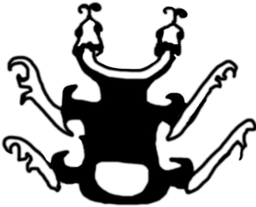
【圖三】《楚帛書》的秋天之神「蓼黃難」畫像

字），分別作為春夏秋冬的四季之神。當中的「玄司秋」——「秋天之神」的名字是「蓼黃難」，它的畫像如下：