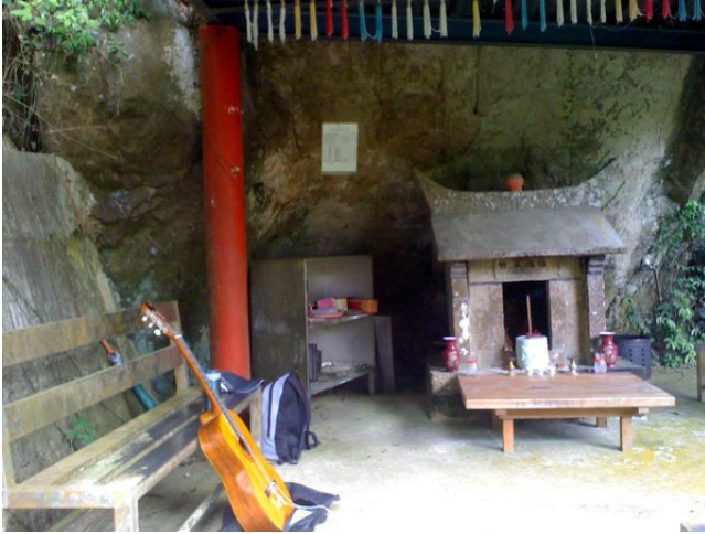
古樸的石砌土地公廟，雖然香客不多，但是附近居民與登山客都會來膜拜