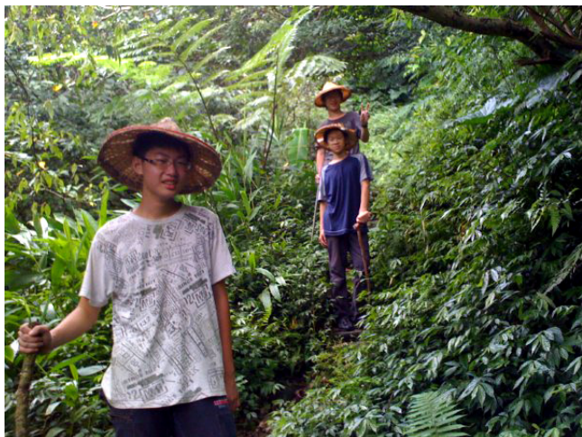
前面這小兄弟已經是準附中人了，或許將來他是國家棟梁；後面那個幾分鐘後將在抵達終點時滑一跤，他會記住我講的話嗎？