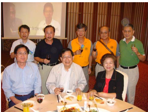
陳龍英老師及師母以及高徒——合勤董事長，明泰副董事長，友尚董事長，前台北捷運公司董事長，鴻海集團副總裁合影。