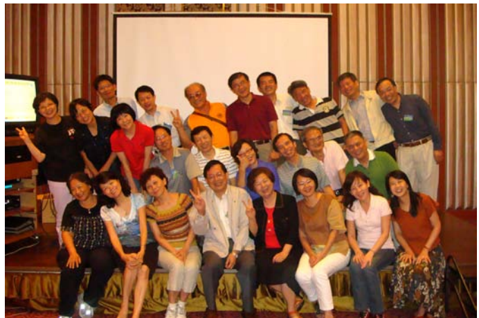
電工 63 「一廿！」的歡樂合照