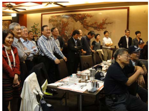
立德餐廳國父紀念館店(後排左五為前經濟部長尹啓銘學長)

尹啓銘兄計控 63，前些日子因公務繁忙，沒有把握能否應邀出席。太史公也用盡關係，與啓銘兄聯絡上，力邀。總算見到了。35 年一別，我只能在報章雜誌或電視新聞一睹啓銘兄之風采。今天見到本尊，氣色很好，神情怡然，語帶幽默，一出口就大家哄堂。顯然未受內閣變動絲毫之影響。幸哉。啓銘兄保重，國家還需要棟樑之材。