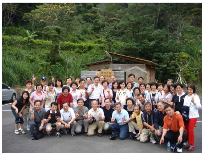
巴巴坑道，交大 63 全體合影(背景別具風味之小屋乃洗手間也)

彭新淼兄提了一大袋柿子跟我說有一攤很便宜，彭嫂特地帶我去。結果生意太好已賣完了。我請教「地陪」導覽林小姐，她說柿餅的價錢算是公道。所以我就去買柿餅。我回來騙新淼兄說去晚了柿子都已曬成「柿乾」了。