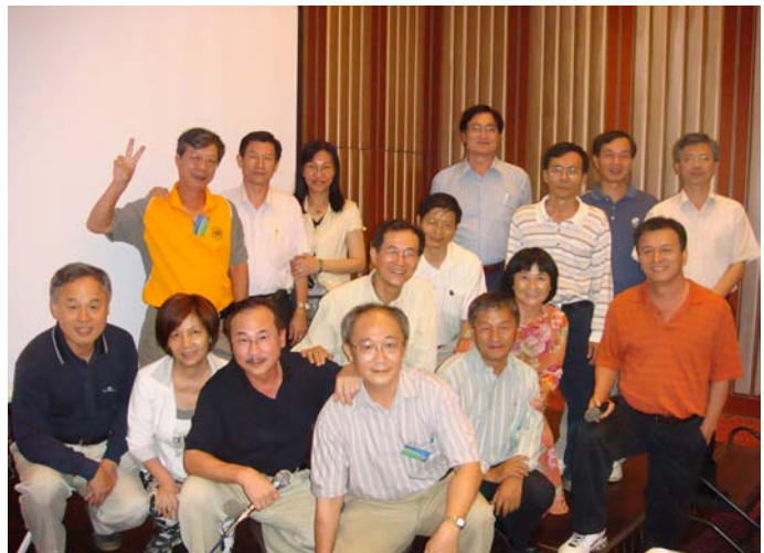
電信 63 合影