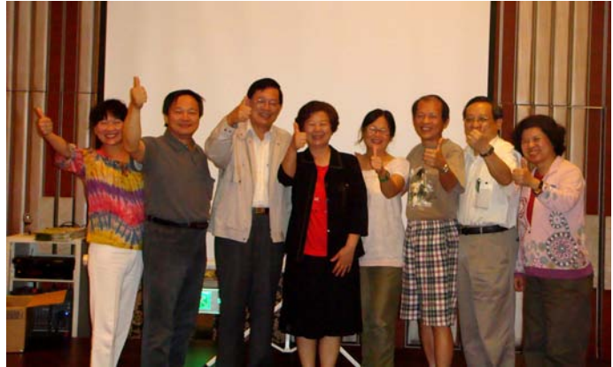
電研 63 「尚讚」

上台，電信 63 全體都上了。QQ 說他唱第三部。OK，那太史公就負責帶第一部。QQ 夫人第二部，蕭蕃第四部。QQ 兼指揮，就唱起來了。起個音，因為太久沒和過音，所以還稍稍練了幾拍和音，就唱了。起音有點高，QQ 說沒問題，好吧就信任高