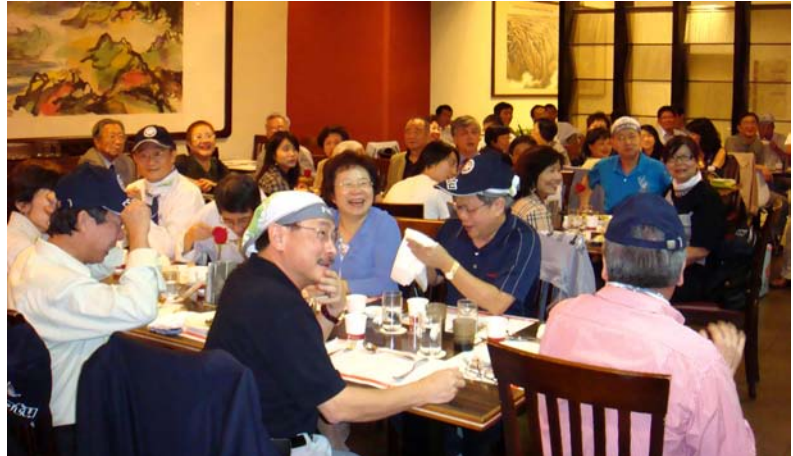
頭戴「綸巾」以及戴「NCTU 棒球帽」之 63 級校友