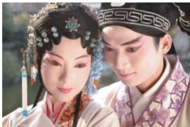
20051222- 白先勇「青春版牡丹亭」

在經營策略上善用交大優秀人力資源，並結合校友與科學園區、地方資源，引進大型優質活動，如與台積電文教基金會合辦「台積電築藝術季」，爭取白先勇「青春版牡丹亭」至交大演出，與台灣應材文藝季合作「蔣勳藝術史講座」、「劉炬渭歌劇講座」，爭取新竹都城隍廟贊助，邀請中國殘疾人藝術團二十一位聾啞殘障演員演出享譽國際的經典製作「千手觀音」，協助新竹IC之音電台辦理「新竹之春音樂節」，為工研院院友