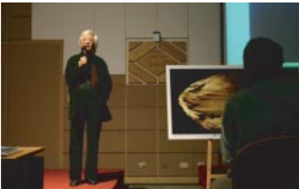
攝影家 柯錫杰「心的視界 - 柯錫杰的攝影美學」

二二年開始，藝文中心特別企劃「浩然講座」系列活動，邀請「國家文藝獎」得獎者擔任主講人，與學生、社區人士分享其投入藝術創作的心路歷程與寶貴的人生經驗，因舉辦地點位於浩然圖書館，講座名稱訂為「浩然講座」，迄今已舉辦八年，每年均吸引來自全國各地的聽眾前往參加，自2007年起結合通識經典講座選修課程，讓更多學生受惠。包括舞蹈家林懷民、羅曼菲、許芳宜；畫家夏陽、劉國松、設計家林磐聳；作曲家李泰祥；作家葉石濤、施叔青；