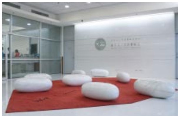
莊普《科學家說...》作品系列一，2004

性如電子材料、晶片、奈米科技等的詮釋與想像，對其人文價值發展出特有的視覺語彙，意圖創造一種藝術與科技的對話。這些公共藝術作品透過比語言更深層的感受體驗與人們的心靈相連結，喚起人們對環境的注意，在審美的感動中成為對交大的共同記憶。