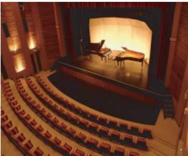
國立交通大學演藝廳

藝文中心擁有兩個展演場地，位於浩然圖書資訊中心地下室的藝文空間，展場面積約180坪，分兩個樓層，是一個極具設計感的精緻畫廊，樓層間設有大量的落地光牆，為展場增添最佳之視覺美感特色。而位於學生活動中心二、三樓的演藝廳，該廳不論燈光、音響、舞台，均極具專業水準，是新竹地區欣賞音樂、戲劇、舞蹈的最佳場地。