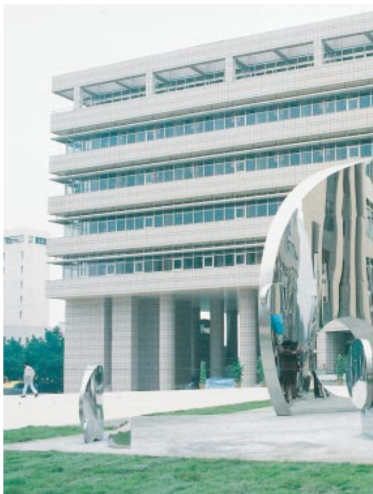
楊英風《緣慧潤生》不銹鋼雕塑，1996

《薪火相傳》、李龍泉《物出真情》、莊普《科學家說...》、黃文英《圓素》等作品，合計十六件作品矗立在校內各個角落，讓校園增添許多藝術氣息。