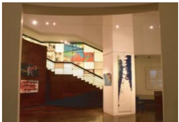
交大藝文空間 - 彈躍時空 線繫古今 - 洪耀個展

位於浩然圖書資訊中心地下一樓的「藝文空間」，是交大師生接觸視覺藝術的重要窗口，每學期舉辦4~6檔包含繪畫、雕塑、攝影、數位藝術、裝置藝術等之展覽活動。中心每個月均邀請國內外優秀藝術家，提供作品展出，並舉辦相關講座研習，以提昇本校師生藝術鑑賞的能力。此外還聘請專人錄