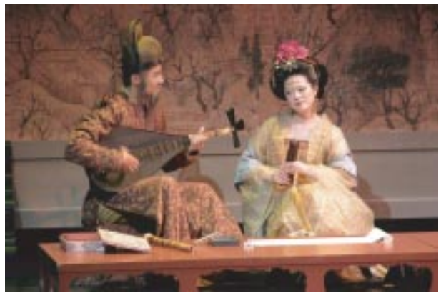
20080521-「霓裳羽衣」- 心心南管樂坊

活動，亦協助校內藝術相關教學研究之進行。藝文中心每年為音樂研究所演奏家教師所組成之「交大室內樂集」策辦音樂會，並協助音樂研究所學生每年五十場的期末與畢業公演，及音樂性社團二十場成果發表。透過藝術季活動，為原本嚴肅陽剛的校園注入鮮活的藝文氣息與柔性的人文思維。