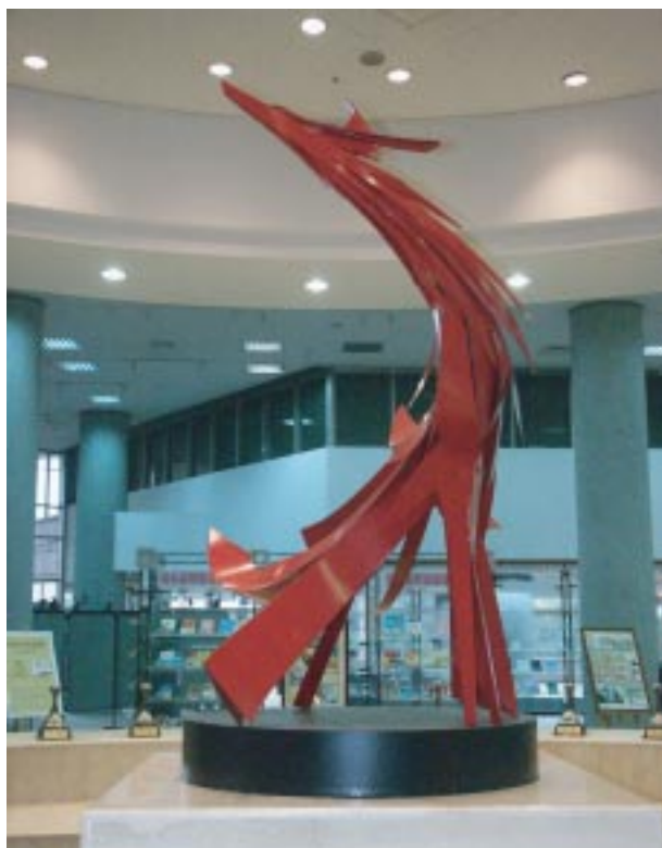
楊英風《鳳凰來儀》，鋼鐵上紅漆，2006

交通大學雖以電子資訊著稱，但因有感於人文乃科技創造力之泉源，歷任校長對於人文關懷的啟發、藝術生活的培養，十分重視，除了在校園規劃上注重人性化之設計外，更在校友贊助下羅致藝術大師的創作，從1996年起即陸續設置多件公共藝術作品，包括楊英風景觀雕塑十二件，加上曾郁文的