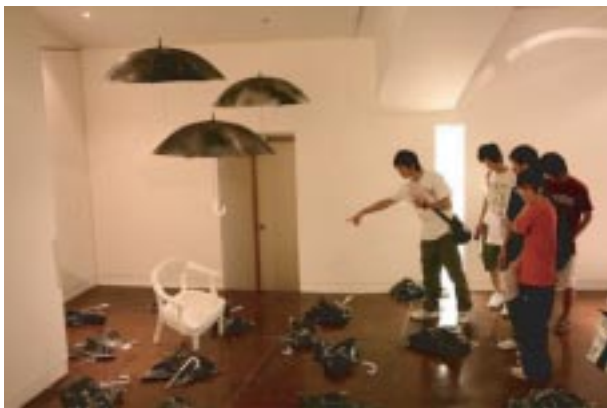
交大藝文空間 - 交大應藝所師生聯展

為使交大師生對校園內之公共藝術有更深刻的認識，藝文中心與交大楊英風藝術研究中心合作，策畫「英風浩然 - 楊英風作品在交大」特展，與系列推廣教育活動，包括景觀雕塑戶外導覽、「風中奇緣~交大校園楊英風雕塑攝影比賽」、認識「台灣現代雕塑史上的楊英風」系列演講，增進學生對這