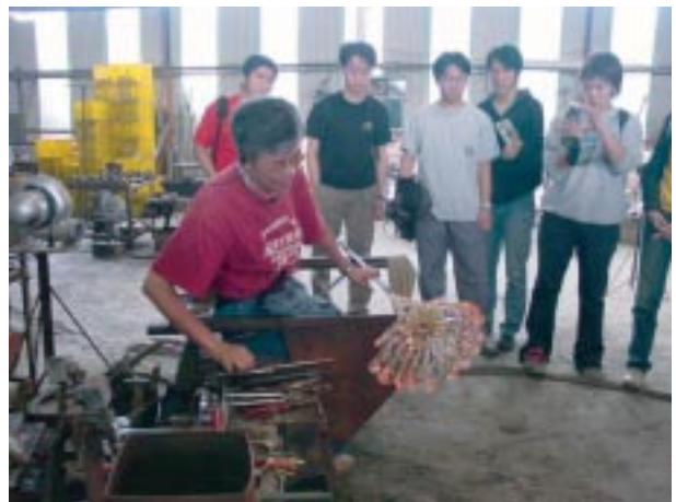
參觀「新竹玻璃藝術家工作室」

為增進交大學生對新竹的認同感，自二年起藝文中心於通識教育增開「多元藝文賞析」課程，並開始推行「走進藝術家」及藝術護照的活動。除邀請學者、藝術家蒞校上課，每個月第三週的星期六規劃校外教學課程，比如「新竹玻璃工藝」主題，則安排「認識竹塹玻璃藝師」、「新竹玻璃發展過程與創作技法」的演講介紹，並走出校門參觀「藝術家工作室」及「玻璃工藝博物館」，頗受學生好評。