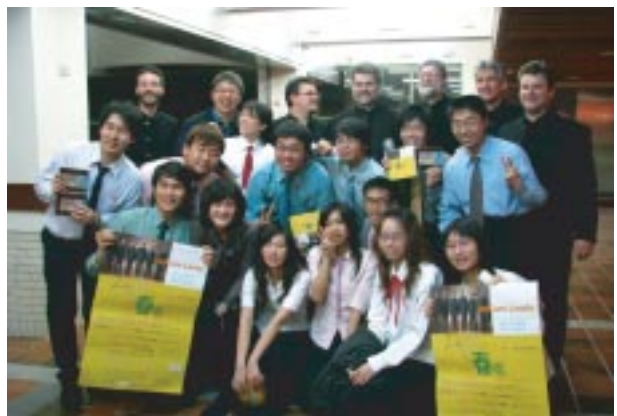
20080310- 匈牙利 UniCum Laude 合唱團

藝術相關活動，在節目規劃上，為確保節目品質，成立「節目評選委員會」負責甄選，邀請國內外傑出藝術家及團體到學校展覽、演出或專題演講。表演藝術類活動，包含音樂、戲劇、舞蹈等，每學期12~16場，場地主要利用演藝廳、中正堂與校園公共空間，為提高學生欣賞之興趣，每場均邀請藝術家導聆及解說，為了培養學生受益者付費的觀念，大部份之活動均採售票方式，由於每年之活動皆精挑細選，經常一票難求。例