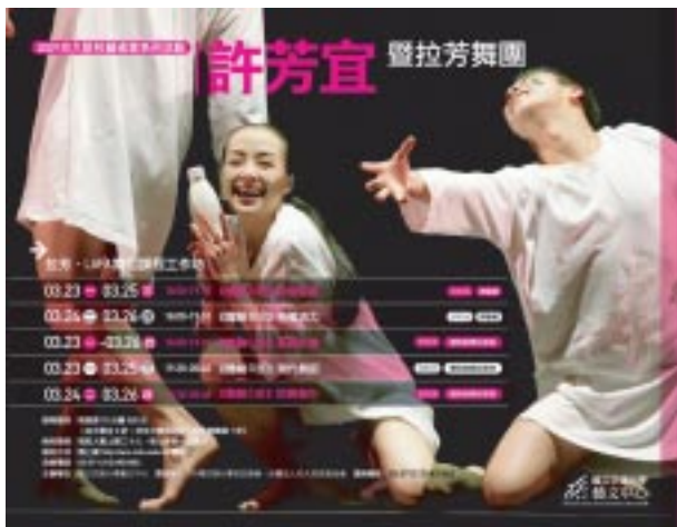
2008 交大駐校藝術家許芳宜與拉芳 Lafa 舞團

為推廣人人都能欣賞藝術節目，縮小弱勢無法參與欣賞的落差，並讓更多的人有進入兩廳院欣賞節目的機會，兩廳院發起「藝術零距離」圓夢計劃，希望結合社會、企業