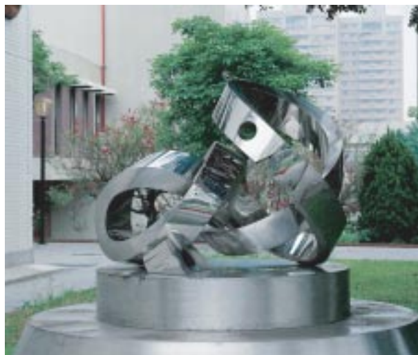
楊英風《祥龍獻瑞》不銹鋼雕塑，2000