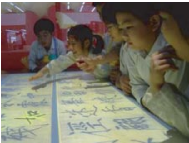
竹北博愛國小學生參觀