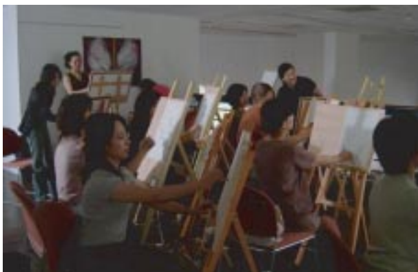
藝文空間場地多元利用 - 義工媽媽素描課