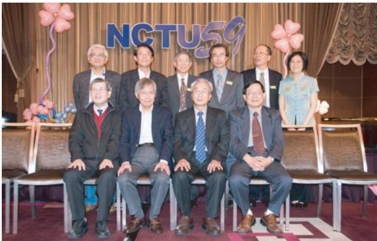
2010 台北，自控系五九級同學會