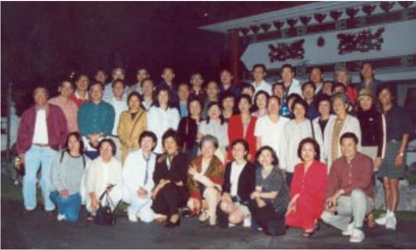
2000 Monterey，電工系五九級同學會