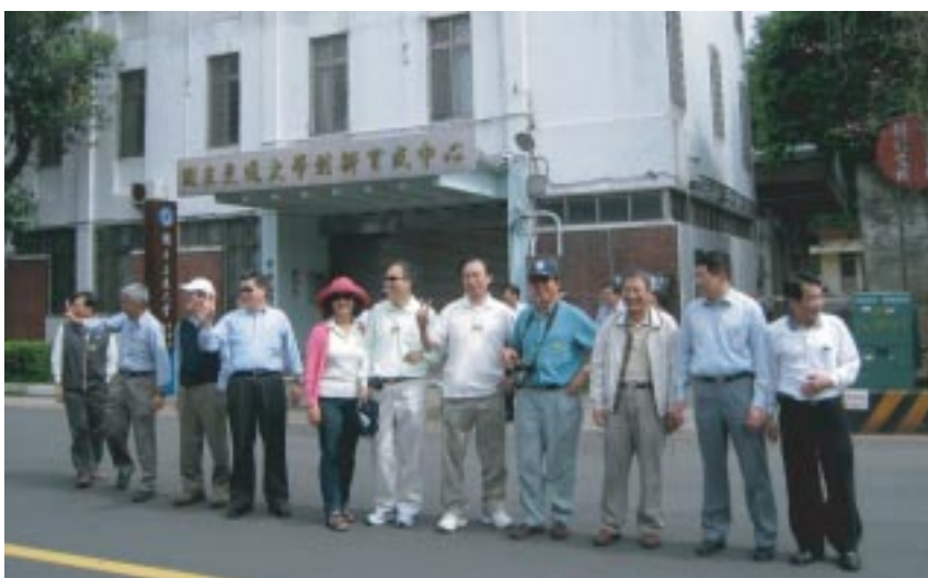
交大第一宿舍「白宮」前