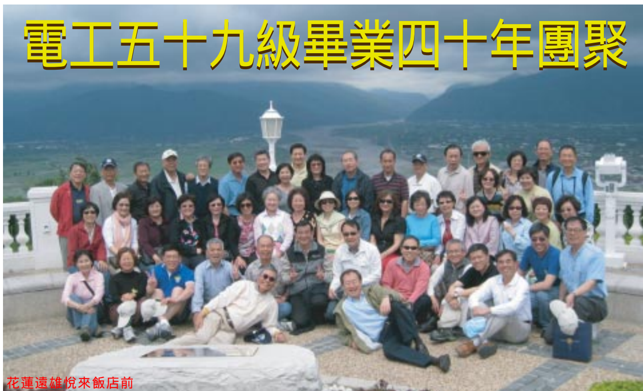
花蓮遠雄悅來飯店前