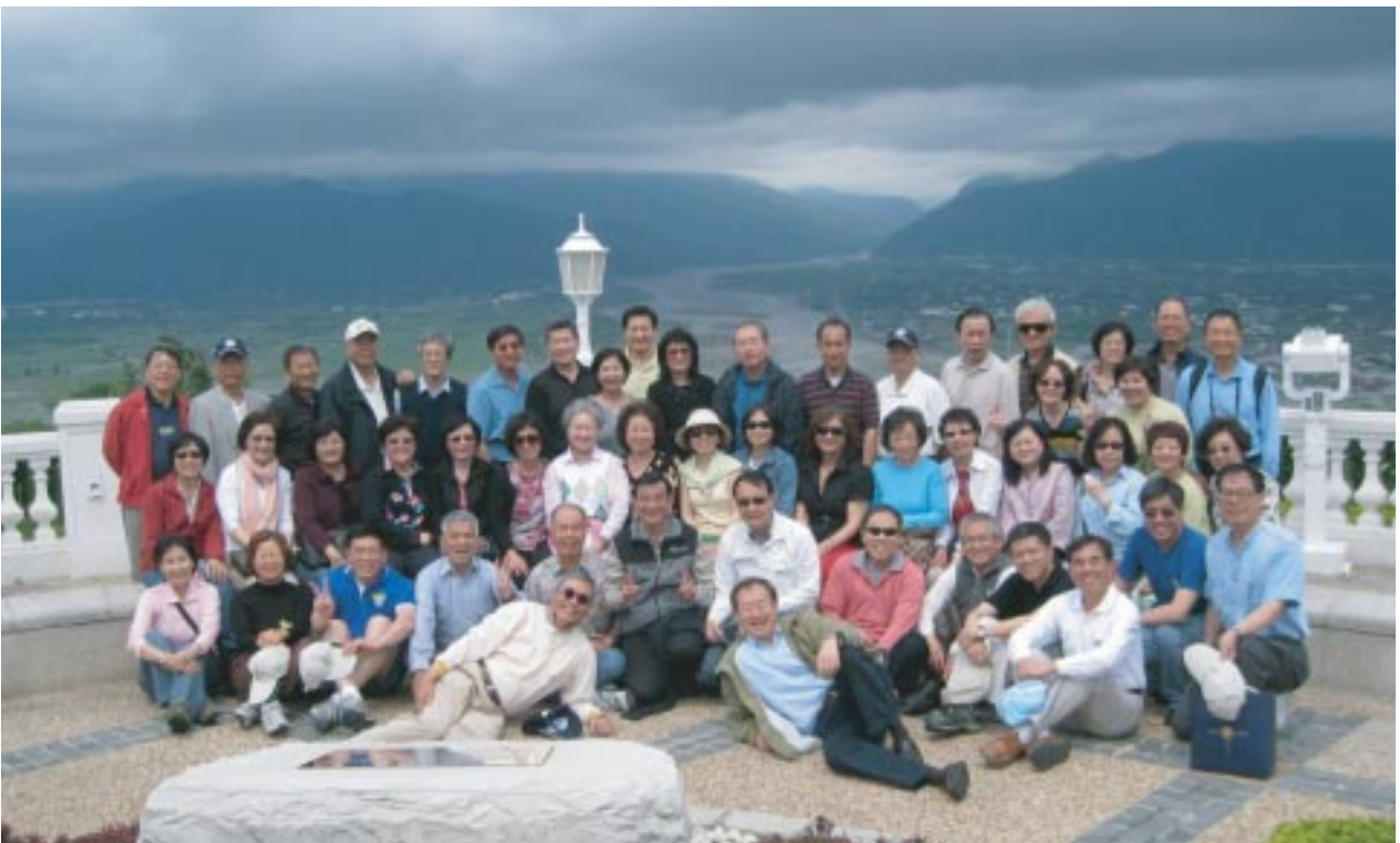
花蓮遠雄悅來飯店前

刻的考慮，所以沒有走九曲洞、燕子口。但是在旅客中心欣賞了一段介紹太魯閣國家公園的影片，相當生動。再加上導遊在旅途中放映的「福爾摩沙的指環」DVD影