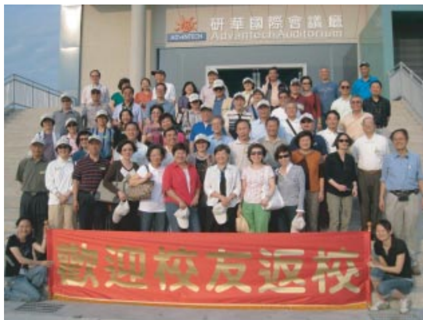
台南新校區國際會議廳

在埔里市區用過午餐後，繼續南下。原先要靠導遊一人獨撐的場面，也完全不一樣了。麥克風傳遞頻頻，學長、學嫂們不斷分享笑話，內容也不自覺地進入A級，車內是笑聲不斷。依我看來，