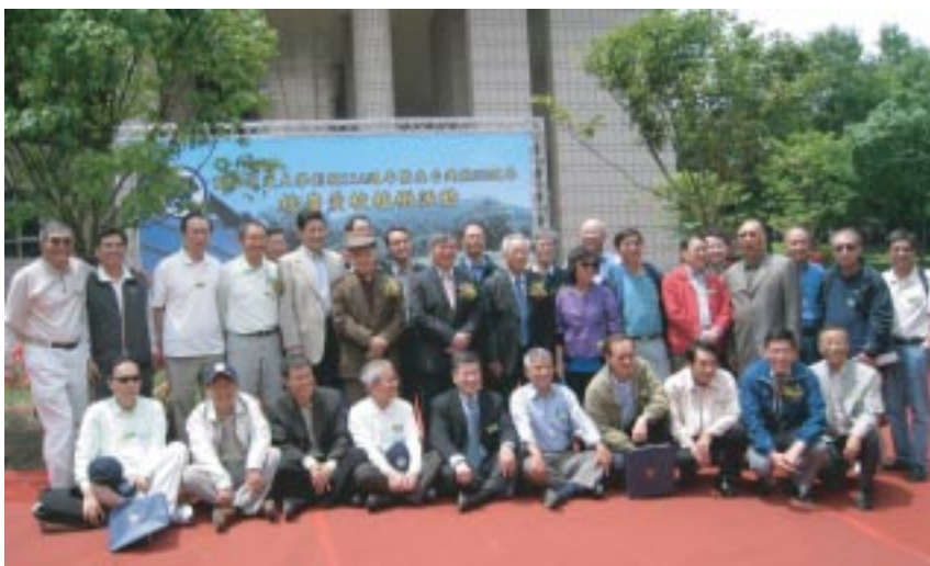
2010年4月10日校慶，愛校植樹