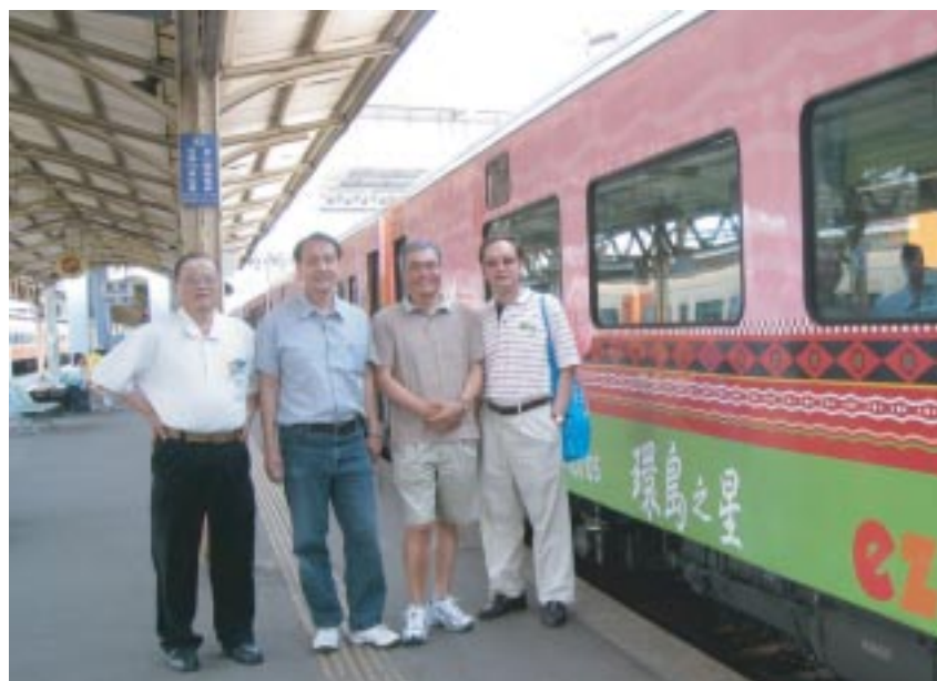
環島之星觀光列車