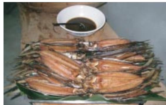
令人垂涎的烤飛魚