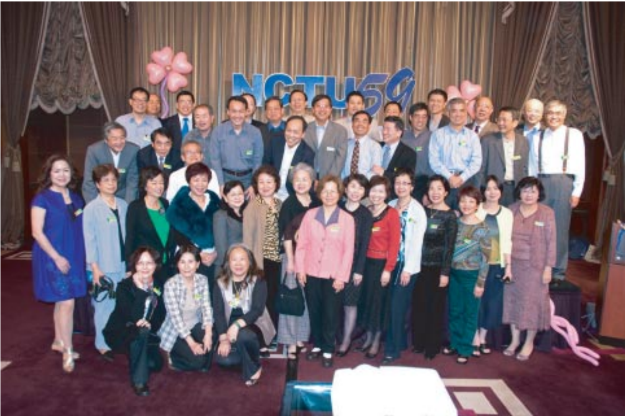
2010 台北，電工系五九級同學會