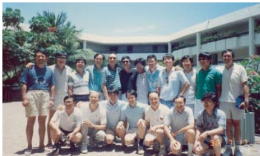
1990 夏威夷，電工系五九級同學會

2000 年旅居美國西岸的學長們，如約在加州的 Monterey(即著名的 Pebble Beach 所在)舉辦了畢業三十年