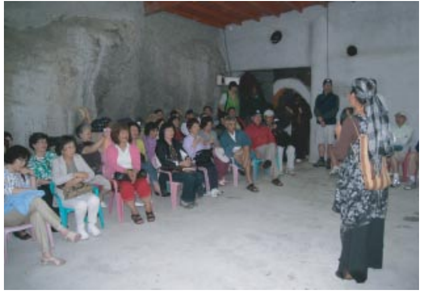
準備欣賞原住民歌舞

七星潭海灘。這裏是石頭玩家的天堂，只見學長、學嫂們忙著在礫石灘上低頭尋找喜愛的小石頭，相互比較收穫。如果不是有重量的顧慮，我想遊覽車一定會多上