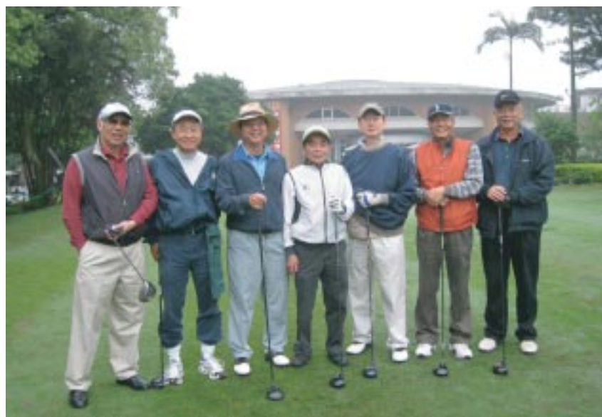
2010年4月9日，桃園球場高爾夫球敘