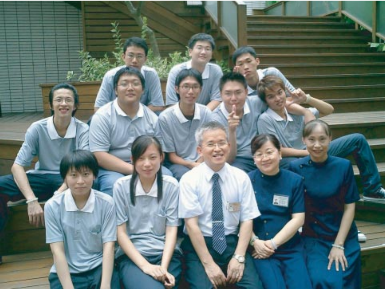
圖說：2004—2008年，林家和學長與學嫂擔任慈濟大學「醫學資訊系」的慈誠爸爸及懿德媽媽，傳承「慈濟人文」精神給學生。