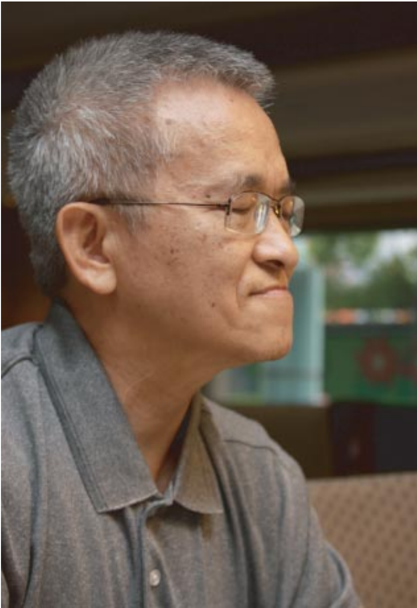
圖說：林家和學長說，「欲知前世因，今生受者是；欲知來世果，今生做者是」，他呼籲大家共創慈濟志業，就能夠造好命。