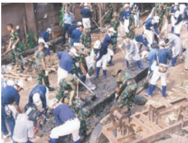
人飢己飢，人溺己溺。慈濟志工踏實的執行力，引起許多人的共鳴。