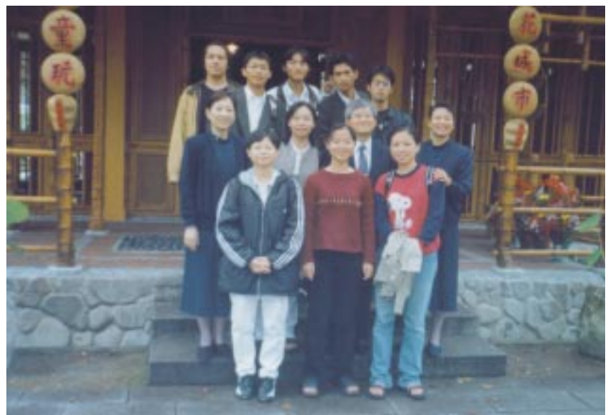
圖說：2000—2004年，林家和學長開始擔任慈濟大學「醫學技術系」的慈誠爸爸，學嫂則擔任懿德媽媽。學長與學嫂還陪著學生路跑10公里，男生限時七十分鐘，女生限時九十分鐘，不然不能畢業。