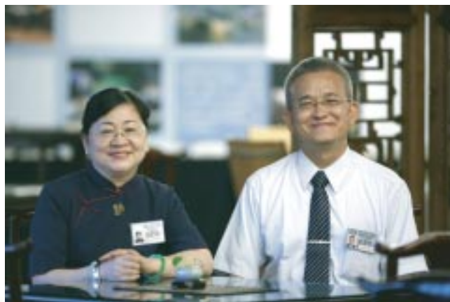
圖說：退休後的林家和學長，與學嫂齊心做慈濟志工。

等於你把老闆當白癡！因為老闆已經評估過了，才會在幾個同事中間選了你。他為什麼挑你來幫他辦事，就是你辦事，他放心。所以當老闆選你，他也知道你沒有經驗，他就一定會幫助你的，你不要一口把他回絕掉，會很傷他的心」。