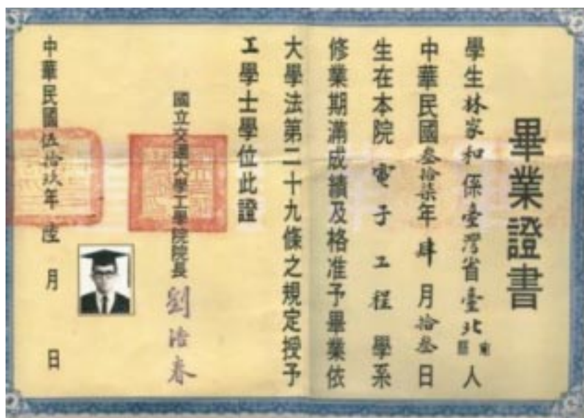
圖說：交通大學畢業證書