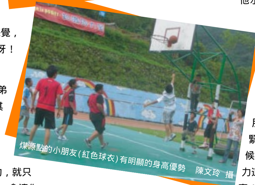
煤源點的小朋友(紅色球衣)有明顯的身高優勢

們想留下的理由，就是和小朋友之間互動的感動！還有夥伴之間的羈絆！想一想那些孩子的笑臉，真的是會融化，他們看著你說「抱我」，你拒絕的時候，他水汪汪的大眼睛看著妳說「可是，我很久沒看到你了耶..」。