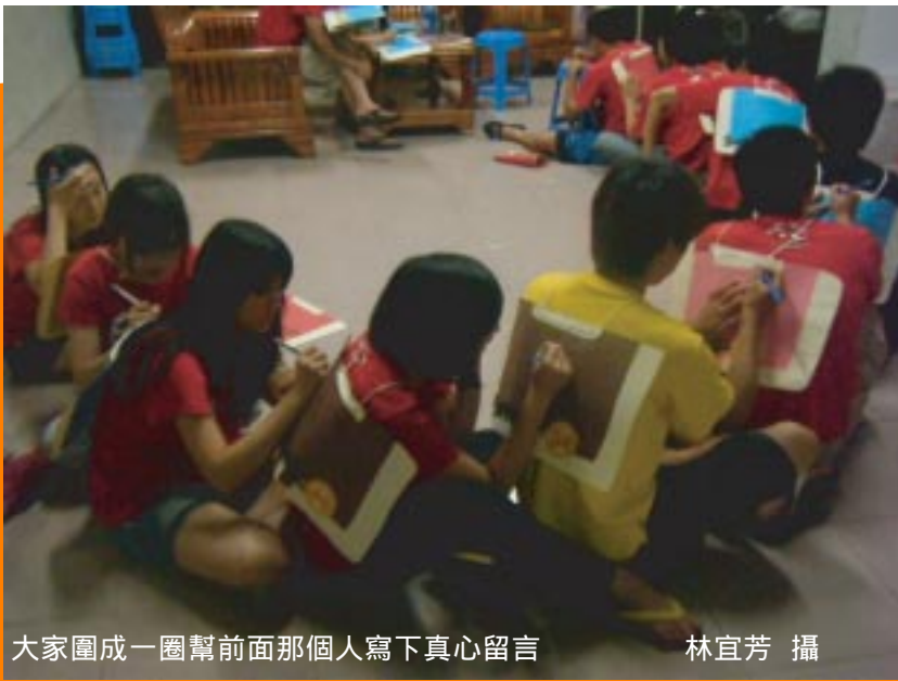
大家圍成一圈幫前面那個人寫下真心留言