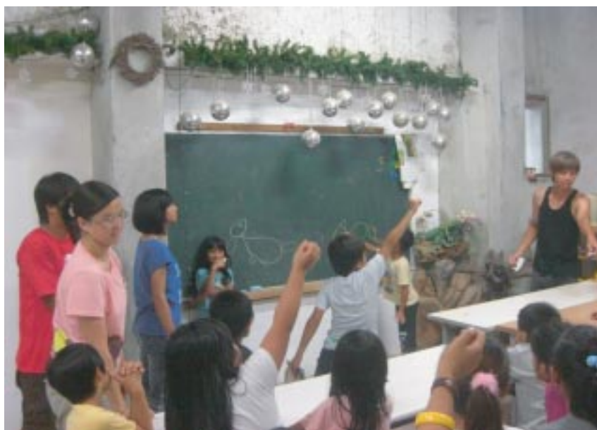
小朋友反應都很熱烈，舉手人過多都不知道該點哪個小朋友