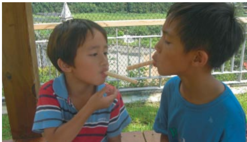
要讓小朋友不先把脆笛酥吃掉，這點就很有難度了！

自然課在做的過程中，比較困難以至於小朋友大部分都失敗，不過我們老師有事先做了五六個示範組，雖然小朋友沒做出來，但還是可以展現給小朋友看，隔天我們還到戶外場地，比了一個小小的噴水比賽，每個小朋友都玩得不亦樂乎！