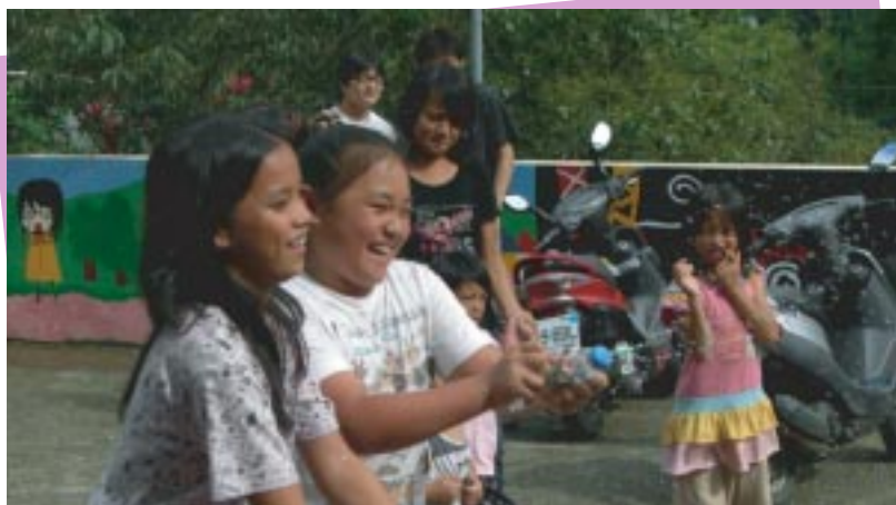
小朋友一玩起水來就停不下來了！

台下小朋友猜，由於小朋友都比較害羞，因此我們事先想好要小朋友做出的動作，藉由小朋友的肢體動作表演出來，再利用計分比賽的模式提高小朋友的參與度，也可從小朋友比的動作中發現，小朋友比的方式和我們想像的不一樣，讓我們這些大哥哥大姐姐驚喜連連。