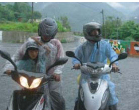
小朋友穿著雨衣讓大哥哥帶她回家