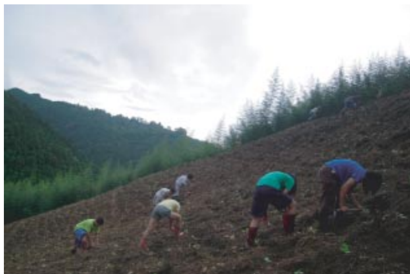
體驗了自己收割高麗菜

特別要感謝達究一家人，不只提供我們許多好吃的食物，也為我們安排許多行程來充實我們這幾天在天湖出隊的日子，在山上的生活什麼東西都需要自己打理，和部落裡的人有著良好友善的關係讓我們在生活上方便許多。來到山上學到的東西到山下還是都可以受用，烹飪的技巧也大大提升，我們從連殺魚都有問題到支解野兔可以做的毫不遜色，這些都可以看到我們的成長。部落裡原住民的熱情是讓我們留戀著山中的原因之一，他們毫不吝嗇奉獻他們最好的東西與我們分享，我們有了困難也會大家一起幫忙，他們的直率讓我們所欣賞。