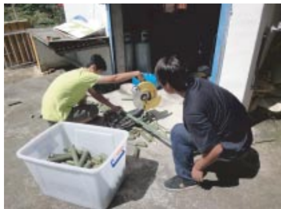
砍完竹子得將竹子裁成做竹筒飯的長度