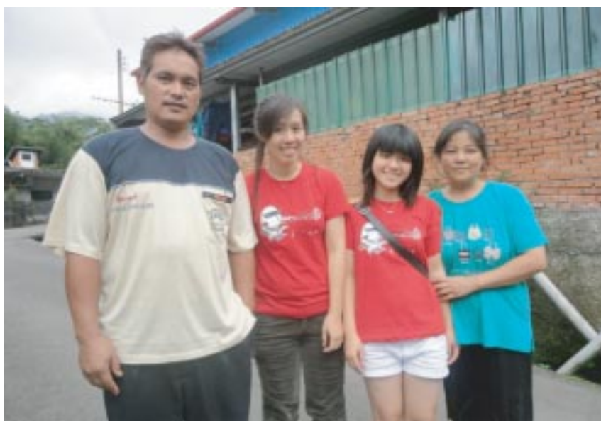
天祥爸爸很照顧我們！