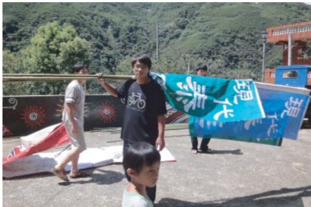
搬著早起砍的竹子，將旗幟插上。

結業那天的晚上，我們把學弟妹聚集在一起，給了他們一個震撼教育，直接在他們面前有話直說，「兒孫自有兒孫福」，這句話我以前常掛在嘴邊，但如今.....經歷過這一年下來，看著學弟妹，有時候會很替他們緊張，我們擔憂我們真的把山服交給他們，之後山服到底會變成甚麼樣子？我們一點出問題，希望他們真的有聽懂，