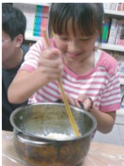
小朋友認真的攪拌馬鈴薯泥

水風車是在保特瓶口，加裝一個風車，再將寶特瓶的加滿水，擠壓寶特瓶讓水從瓶口噴出，推動風車轉動，