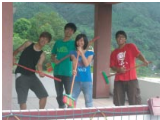
打掃連日來積水的陽台，大家所幸忙中作樂，拿起打掃工具組個團