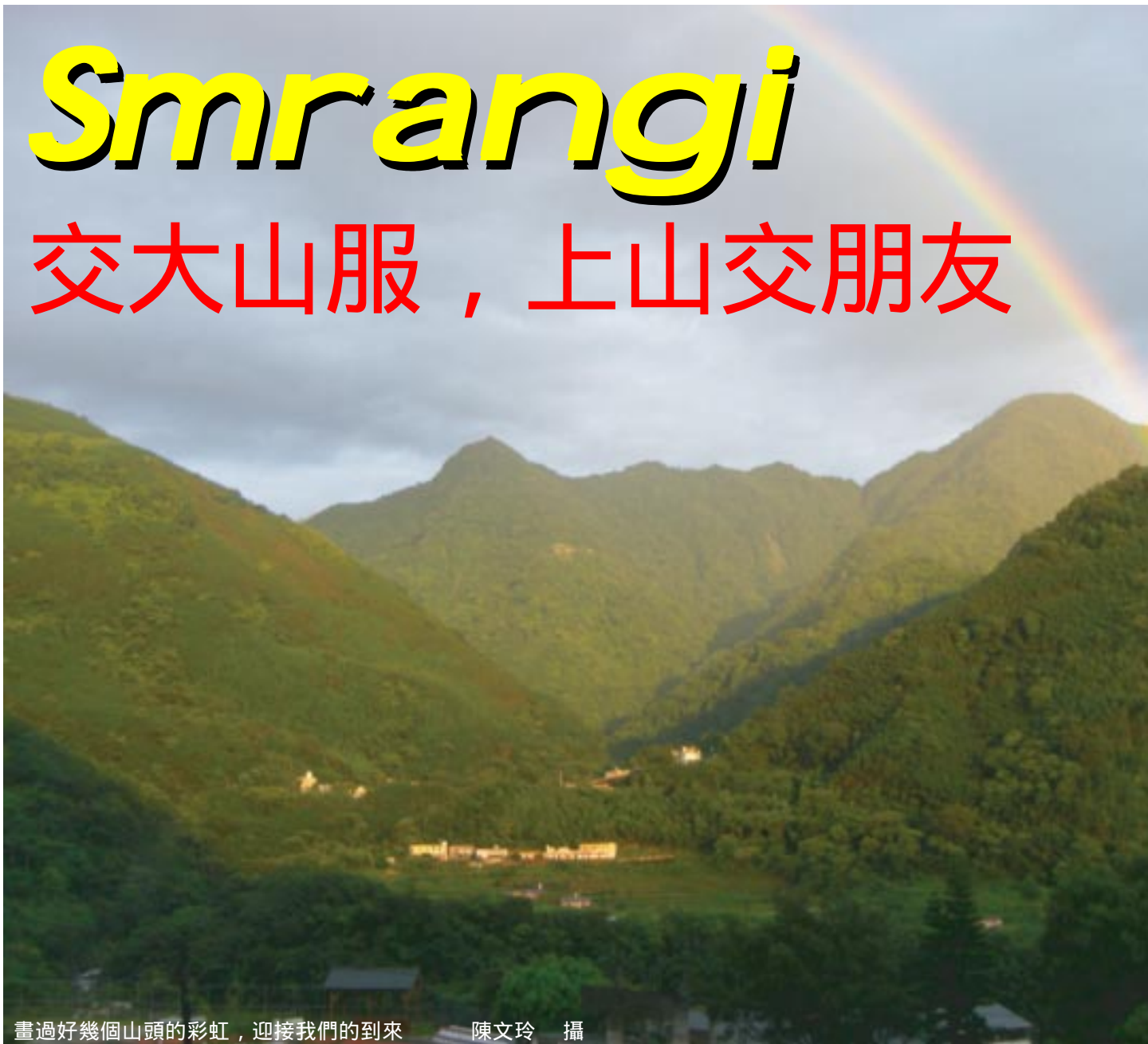
畫過好幾個山頭的彩虹，迎接我們的到來