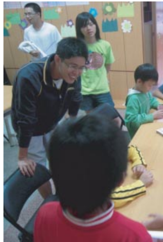
雖然小朋友變少了，但笑聲還是一樣大聲