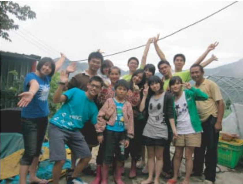
竹林人大合照，去年的學長姐都回來了！