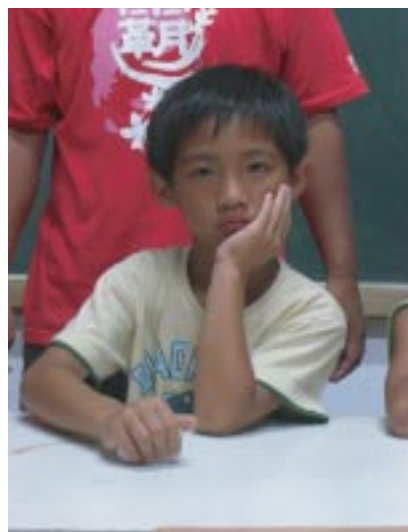
如果課程讓小朋友等太久，他們就會開始無聊。