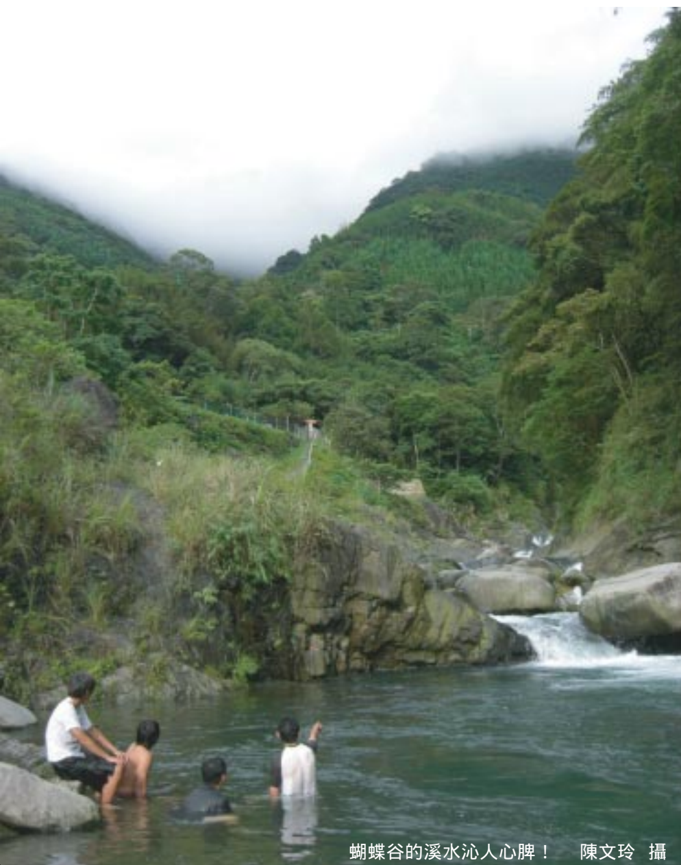
蝴蝶谷的溪水沁人心脾！