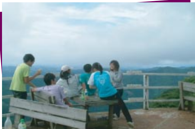
相思園的觀景台，此時由比麟點的人獨占