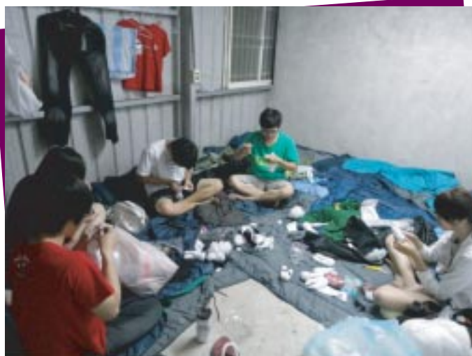
做給小朋友的禮物襪子娃娃

出隊五天的行程為早上八點起床梳洗、煮早餐吃、跟小朋友玩，九點半帶中部落小朋友去教會，接上部落的小朋友下來，開始一天的課