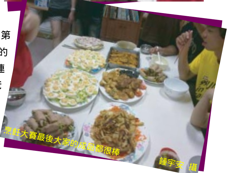
烹飪大賽最後大家的成品都很棒