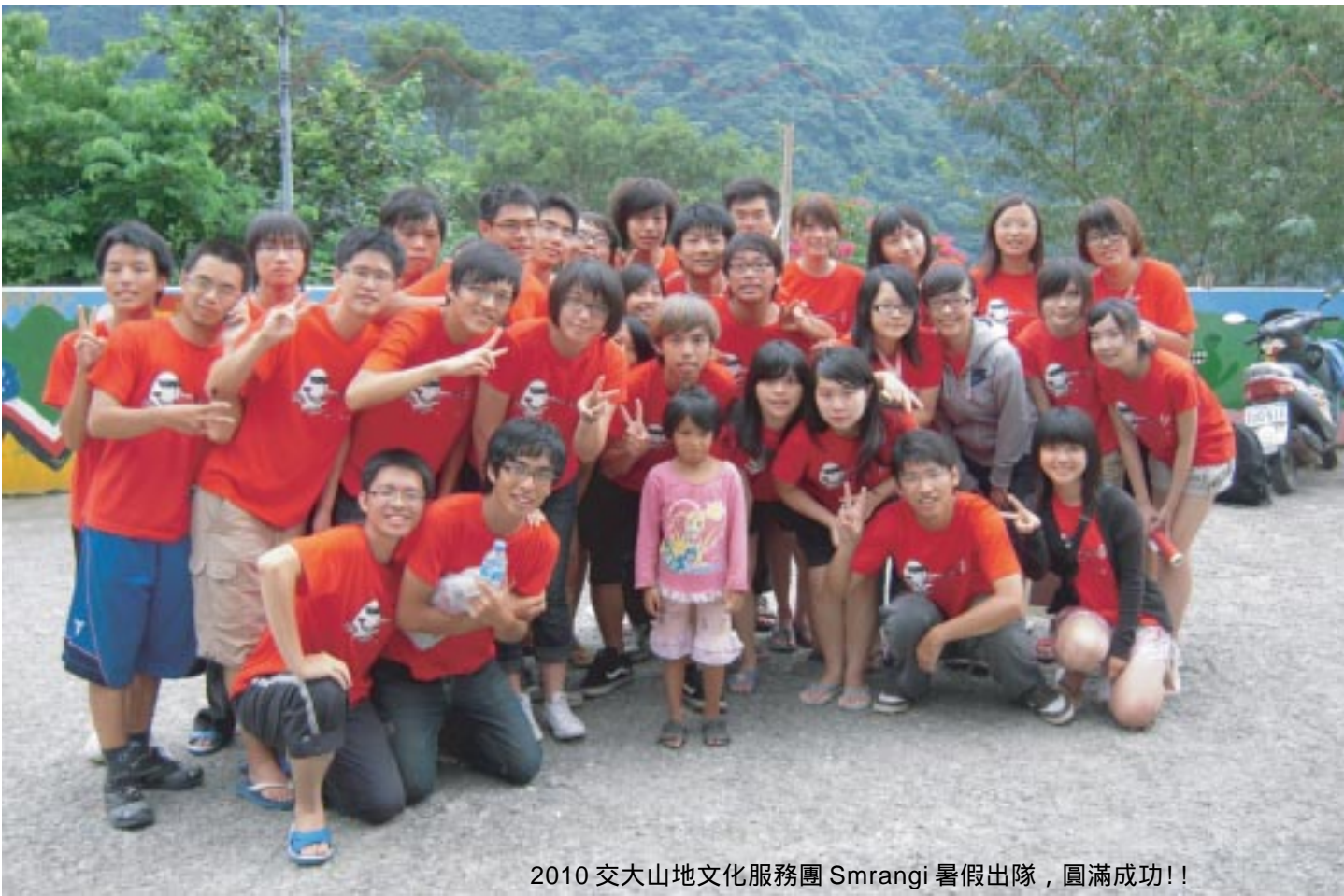
2010 交大山地文化服務團 Smrangi 暑假出隊，圓滿成功！！