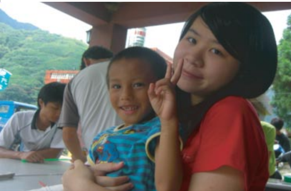
伊東終於得逞讓我抱他，開心得比出勝利的手勢