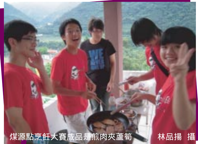
煤源點烹飪大賽成品是煎肉夾蘆筍