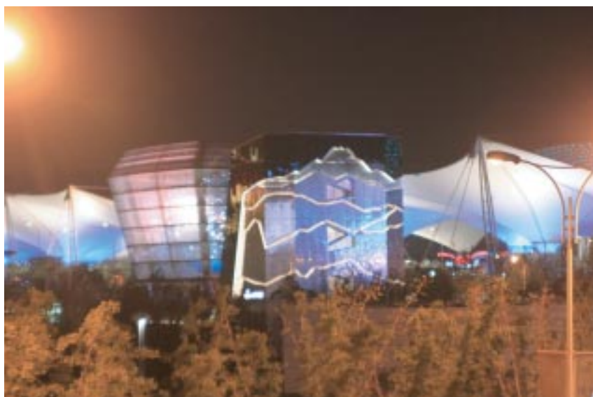
玉山造型的背景很特別吧？！