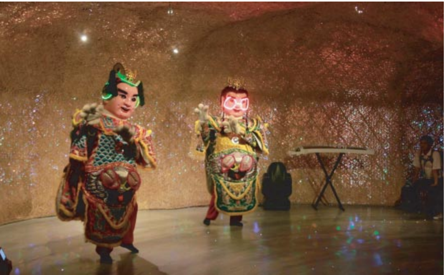
台味十足的電音三太子

一梯是欣賞二胡。說真的，雖然二胡可能更接近童年回憶，可是電音三太子比較有趣的說.....。