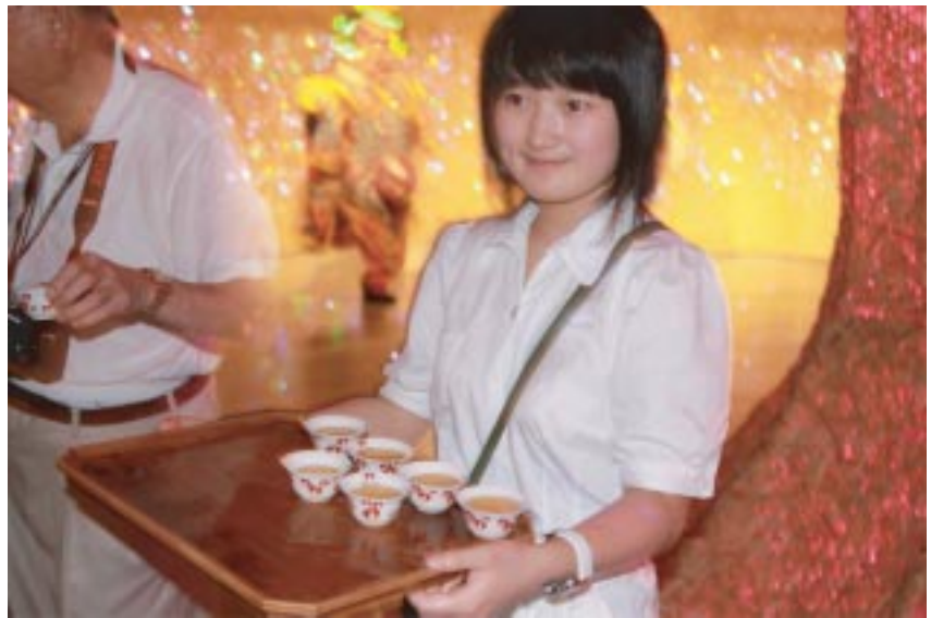
奉茶，清香撲鼻的高山烏龍茶。

太平洋的水。這些東西都是從台灣空運過去的，本來驚訝於「這麼費工？」，後來我才發現，只要國力充足，每個館都空運一大堆東西，大概「世界博覽會」就是要這個意思吧？