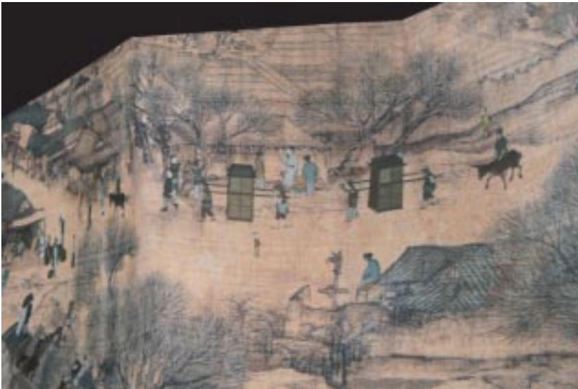
清明上河圖，動畫版，驚嘆聲四起！