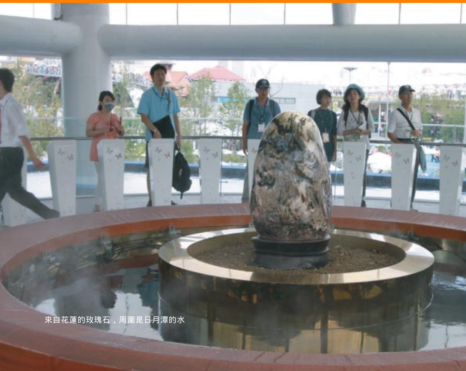
來自花蓮的玫瑰石，周圍是日月潭的水