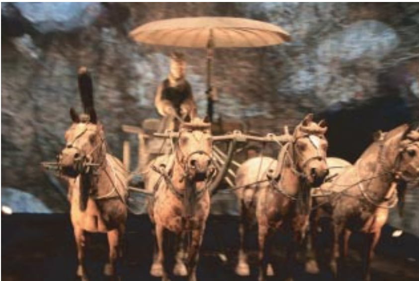
始皇陵一號的銅車馬