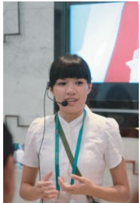
這是我們這一批40人的美麗解說員

在聽過蔡依林唱歌後，我們來到外觀是球體的720度4D劇場。進去之前不了解4D是哪4D，我還開玩笑跟同事說：總不會灑水到我們身上唄？誰知導覽員真的說如果水珠子灑到身上不要太訝異，又因為是720度環場，所以如果頭暈腿軟的話請蹲下來。嚇！