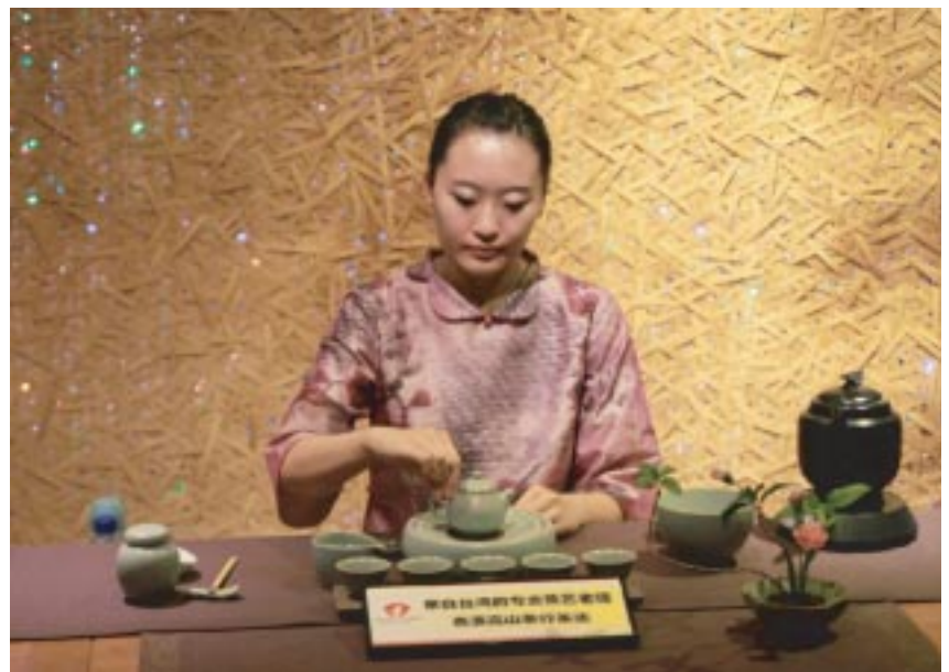
品茗後，欣賞茶藝師傅表演