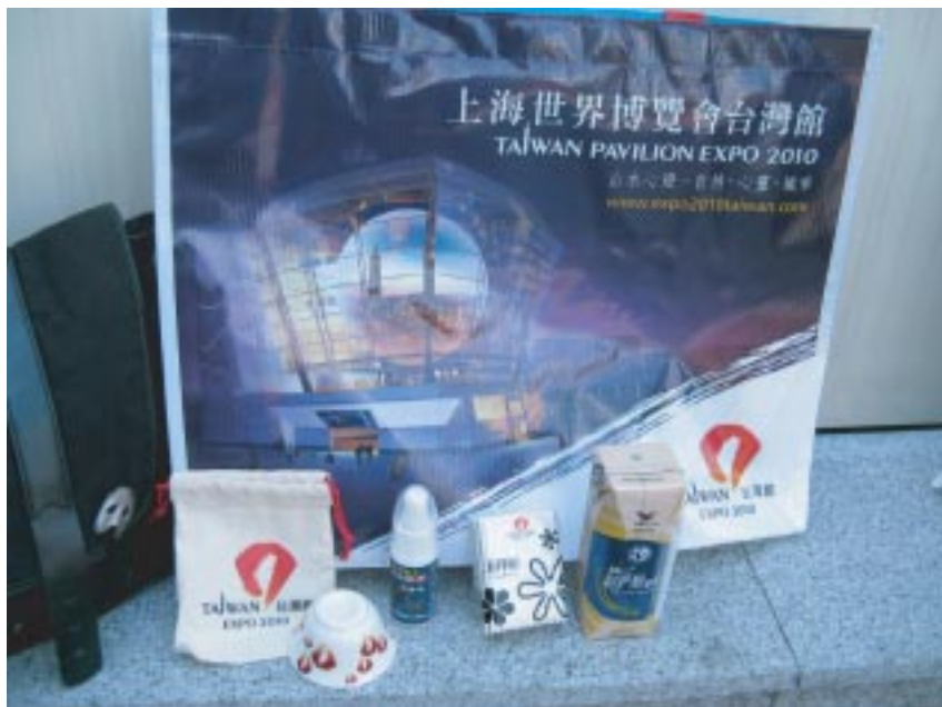
台灣館超貼心的紀念品