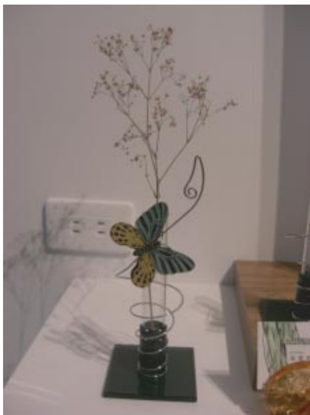
吳寬亮的作品講求美感，蝴蝶玻璃在小花瓶旁飛舞。

台灣都沒有認識的玻璃藝術同好，是因為在竹塹他才認識了大家，這點他很開心能夠在竹塹找到同好，而且還辦了一系列的玻璃展示活動。