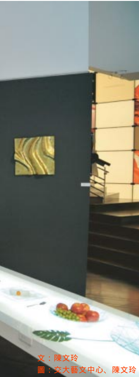
文：陳文玲