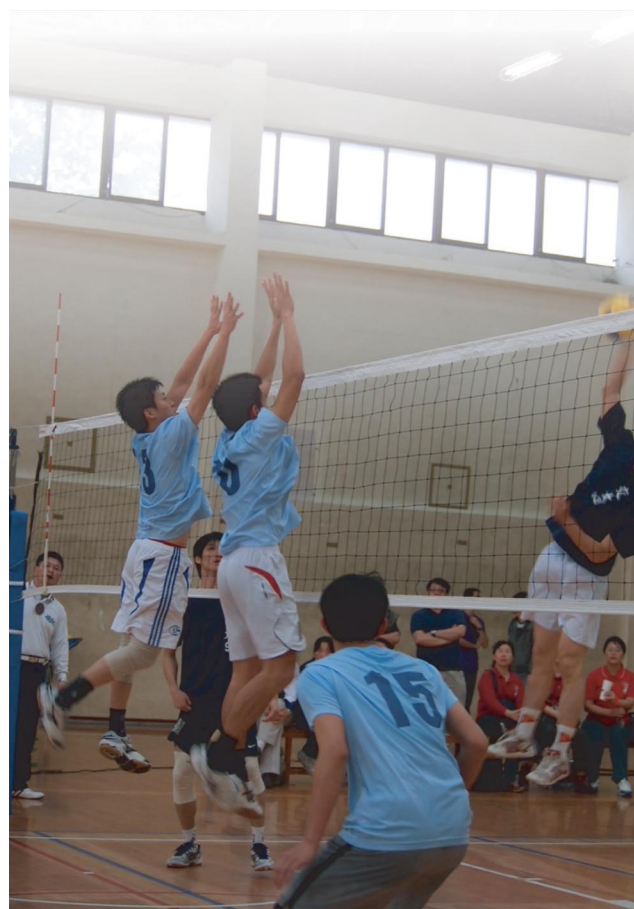
交、清實力相當，兩隊皆可攻可守，以至比賽打了五局才能分出勝負。

打，用牢不可破的防守輔以多計精彩的攻擊球，在比賽一開始就連連得分。其中交大背號5號的選手在網前連續攔下兩計殺球，為交大隊提升了不少士氣和信心。但清大也不是省油的燈，在交大千辛萬苦獲得2：1的領先後，在第四局以高超的技巧和精彩的默契，逼得交大原本領先的比數被逆轉後，再也無法超前清大。清大背號12的選手，防守時反應極快，攻擊時力道極大準度極