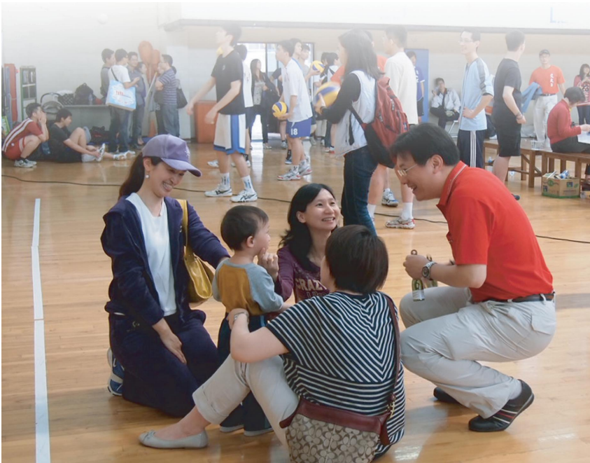
當天場邊不乏前來為選手加油打氣的家屬團。跟正式梅竹賽不同的是，那天的家屬團不是選手的父母，而是妻子和小孩。