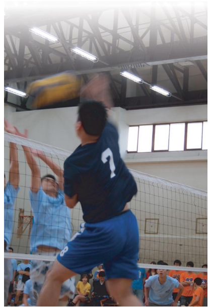
交大背號 7 號選手一計漂亮的跳殺得分。

只為求勝的表現，而是為了健康、為了球隊情誼、為了曾經無比勞累的付出、為了讓家人也能參與自己輝煌過去的途徑。