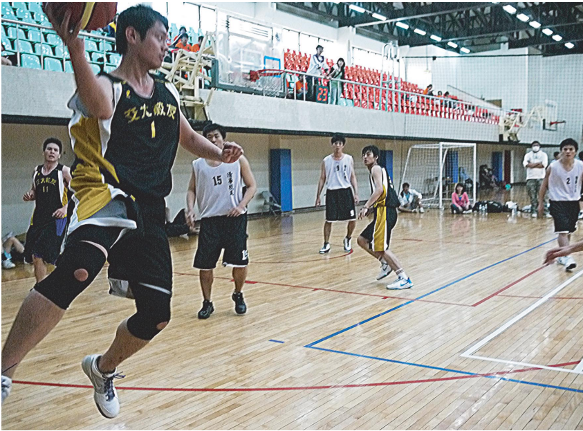
交大 1 號為了救球彷彿飛了起來！