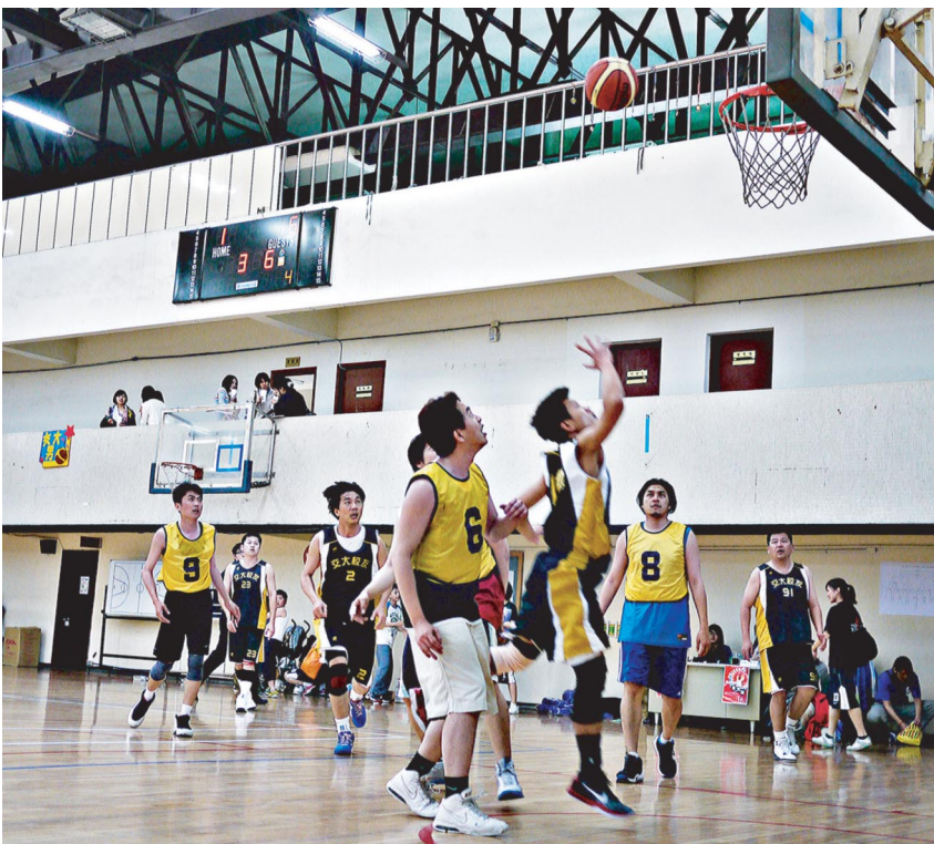
壯年正值青春，交大球員(黑衣者)絲毫不減當年威風。

第四節，最關鍵的一節，雙方你來我往，雖然交大靠著 71 號和 12 號球員將比數拉開為 30：26，但清大也不是省油的燈，4 號球員馬上以一記三分球和罰球瞬間扳平比數。這是第二節以來雙方首