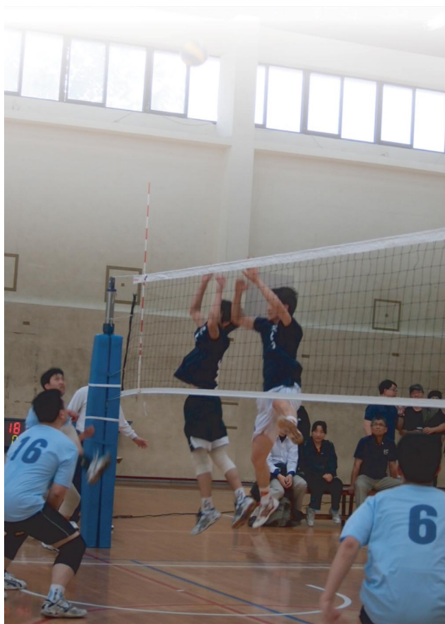
交大的防守實力不容小覷，圖為選手們對付清大攻擊球時的攔網英姿。