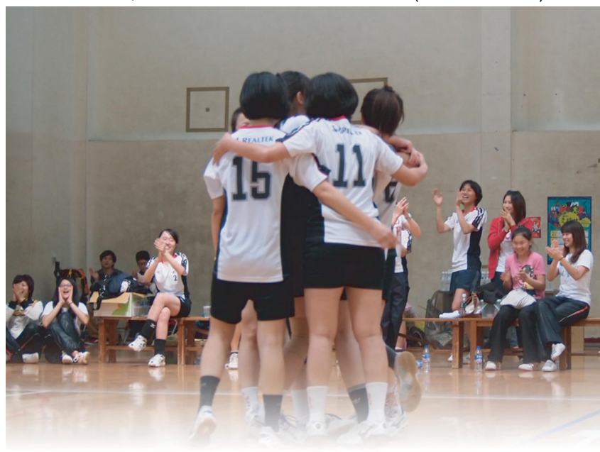
交大女排隊取得勝力時的擁抱。