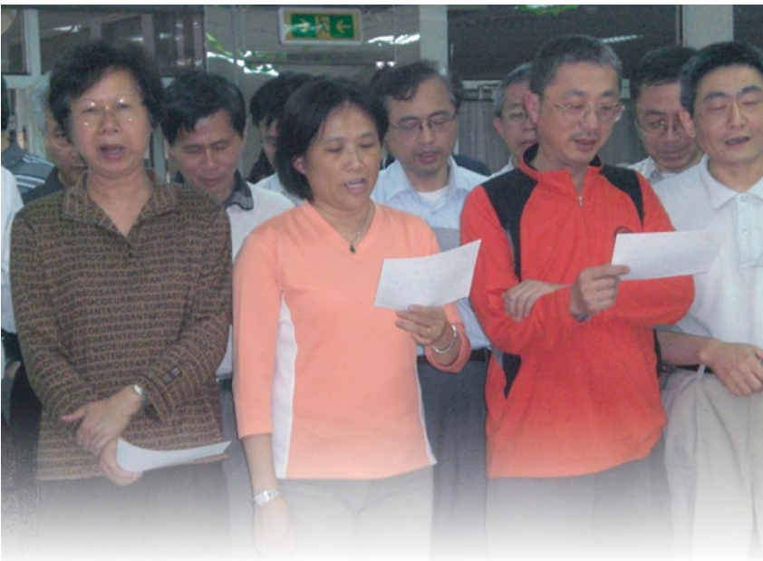
交大校友們十分認真地唱交大校歌。在老梅竹橋藝賽中有著一個傳統，那就是到了中場休息的三十分鐘時，會安排兩校校友分別上台獻唱校歌。