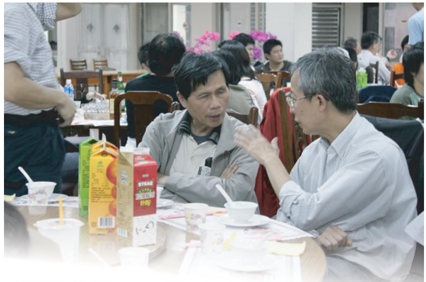
老梅竹賽結束後，清、交校友們紛紛聚集到餐廳聚餐、聊天。

老梅竹橋藝賽大約在下午五點半左右結束 13 輪的比賽，最終結果由交大校友隊以團體名次平均值 15.65：26.23 成績獲勝。而在比賽過後，老梅竹賽的所有清、交校友們便會慣例地在一起聚餐，並舉行頒獎典禮。本屆