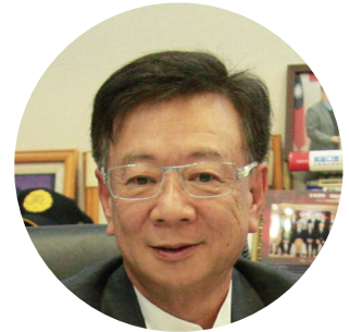
聯電榮譽副董事長