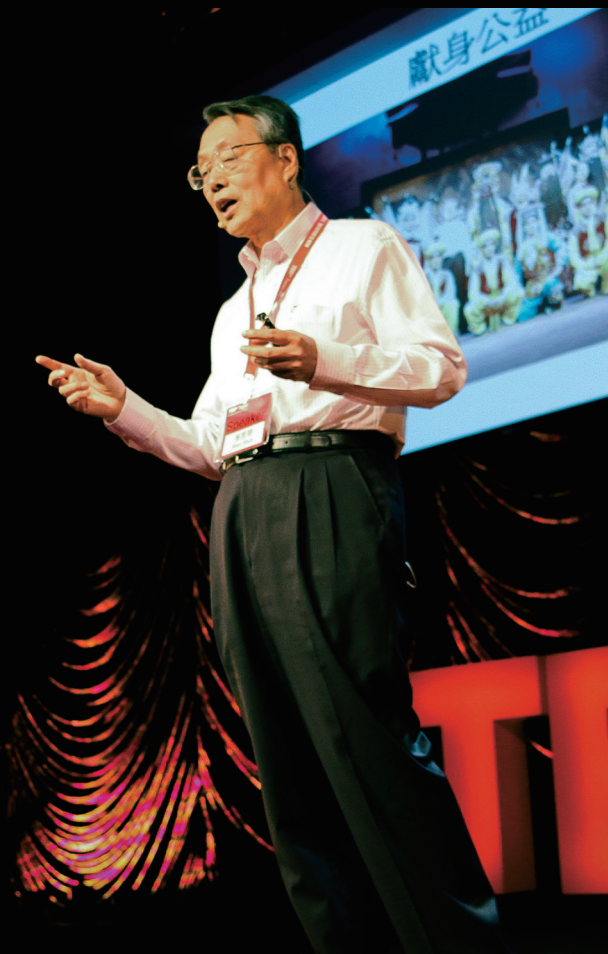
宏碁集團創辦人 施振榮先生