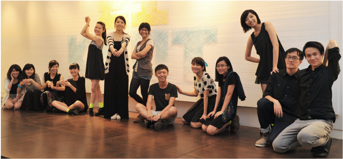
參展的十三位畢業生開幕大合影

前些日子交大校園內的佈告欄出現貼滿了一大幅的神祕圖騰，透過DZ拼接成連續圖案的方式，遠看是佈滿黃色藍色黑色的符碼，近看發現是由中英文所組成的文字，許多經過的同學們都在猜這究竟是什麼活動，原來是應藝所同學們所規劃的畢業創作展「結 ZONT」。