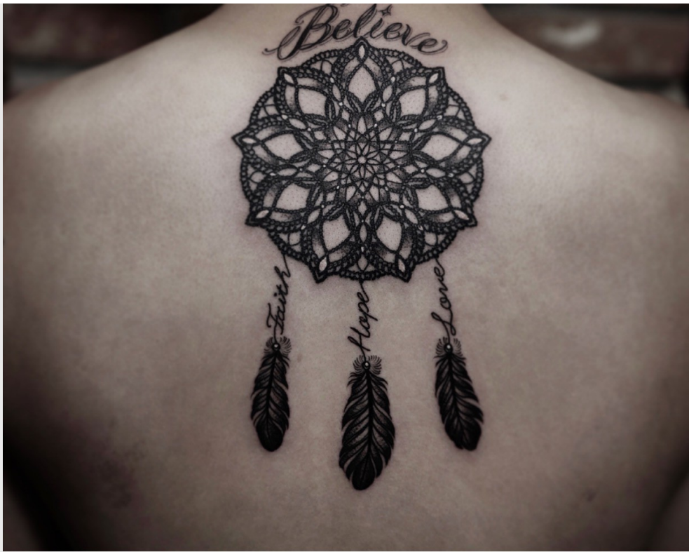
用刺青來表達對世界的寄望。

了解完晴刺青背後的含義後，我才意識到原來刺青不只是一個圖案，它也包含了刺青者自己的想法和信仰。